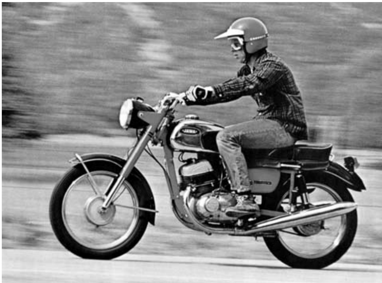
▲ Jawa 350 typ 362/00/04 Oilmaster v plném tempu. Snímek z reklamního letáku American Jawa Ltd. pro rok 1972