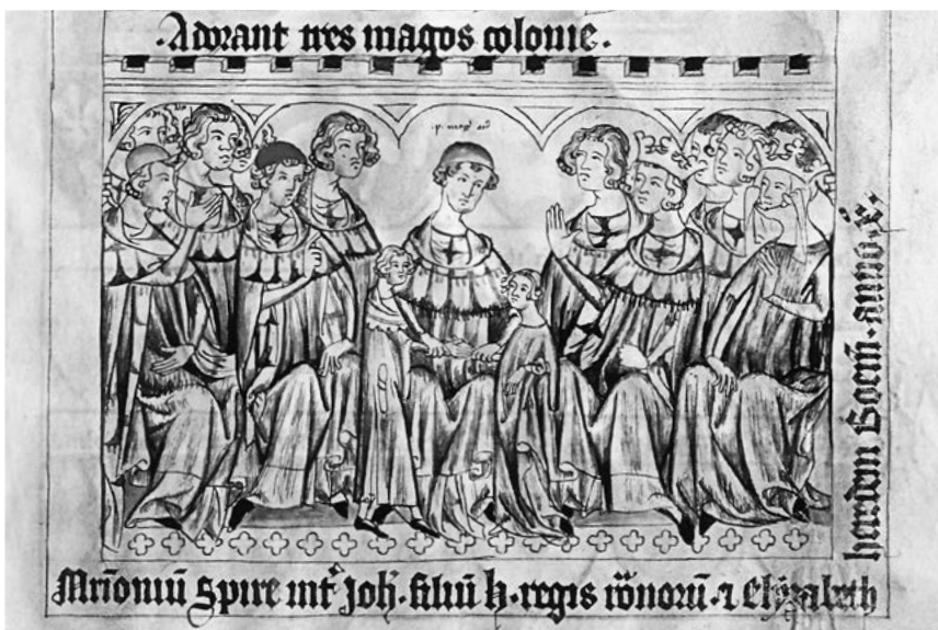
Svatba Jana a Elišky, kolorovaná kresba perem na pergamenu, Codex Balduini Trevirensis.

se podrobit Jindřichu Korutanskému. 110 Stejně se zachoval Kolín i někteří nedávní stoupenci opozice, jmenovitě Oldřich z Lichtenburka a jeho syn. 111