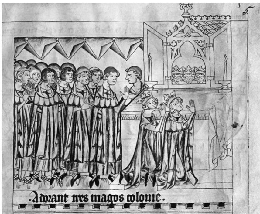
Jindřich VII. a Markéta Brabantská adorují relikvie Tří králů v katedrále sv. Petra v Kolíně nad Rýnem, Codex Balduini Trevirensis (tzv. Balduineum), před polovinou 14. století.

rodu pánů z Avesnes, který měl úzké kontakty s Francií. Jako poručník se jí po boku objevil nejprve její otec, jehož vystřídal hrabě Guido I. z Flander. Skutečným rádcem hraběnky se však stal představitel lucemburské šlechty Gottfried z Esch (Esch sur Sûre).