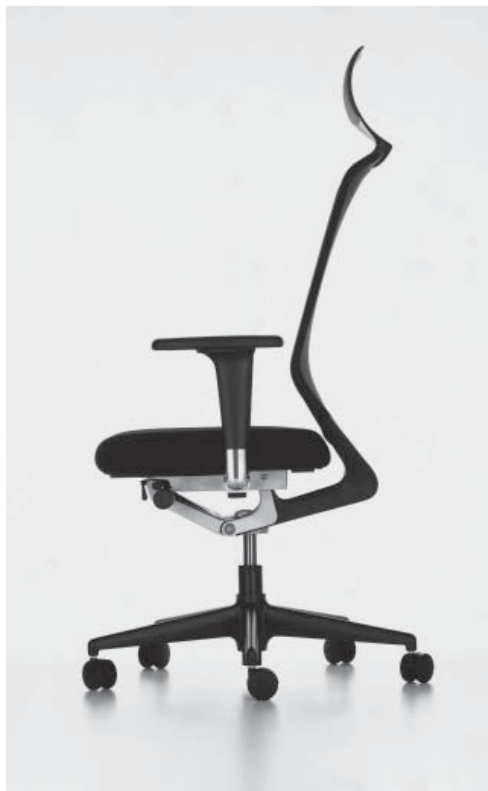
Dobrá židle paradoxně omezuje pohybovou aktivitu, manažer necítí potřebu ji opustit

Při navrhování nábytku je třeba zohledňovat člověka v jeho různorodostech, jako je tělesná výška, hmotnost, věk, pohlaví, rasa, povolání. I přes uvedené rozdíly musí vzájemný vztah mezi uživatelem a navrženým zařízením zajišťovat pohodlný a bezpečný požitek z tohoto prostředí. Někdy