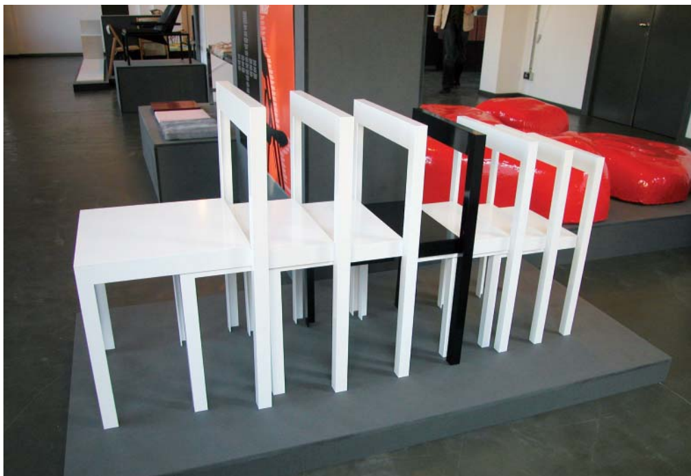
Individuální výrobu je možné provádět pro neomezené množství typů

Růstové a hmotnostní změny populace působí na dimenzování nejrůznějších předmětů denní potřeby (oděvy, obuv, ale i nábytek). Ty jsou v hromadné výrobě navrhovány pro anonymního uživatele, který patří do určité podskupiny jedinců. Snaha výrobce optimalizovat a racionálně standardizovat výrobky musí proto vycházet ze znalosti statistických vlastností tělesných rozměrů předpokládaných uživatelů.