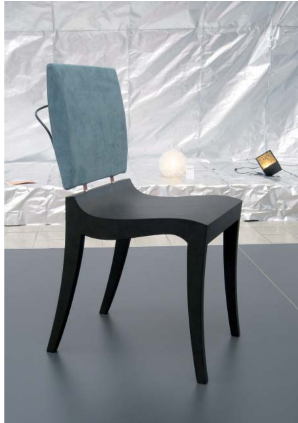
Římskou židli klismos se inspiroval i Thibault Desombre

Rozměry lidského těla se však liší v souvislosti s věkem, rasou, pohlavím, proporčností a někdy dokonce i zaměstnáním. Rozdíl mezi ženou a mužem vycházející z odlišného habitu obojího pohlaví je evidentní. Výškové rozdíly jsou zřejmě ovlivněny stravou a klimatickými podmínkami během dlouholetého vývoje. Obecně lze říct, že jičané v Evropě jsou menšího vzrůstu než severané. V dnešní době globalizace však tento rozdíl oslabuje. Snad nejmarkantnějším faktorem