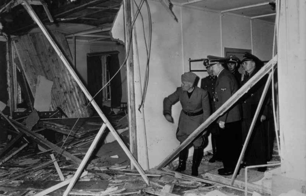
Mussolini si za Hitlerova doprovodu prohlíží místnost, v níž došlo k neúspěšnému bombovému atentátu na německého vůdce, červenec 1944.

Hitler zázračně vyvázl bez většího zranění a krutě pak zúčtoval se strůjci atentátu a pokusu o převrat. Sny o tisícileté říši hákového kříže utrpěly další vážnou trhlinu; nemohlo být pochyb o tom, že už i německý generální štáb je nakažen virem poznání blížícího se hořkého konce.