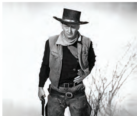
Červená řeka (1948) od Howarda Hawkse je westernem bez příkras, protože ukazuje honácký úděl v celé jeho úmornosti. John Wayne tu hraje typického akčního hrdinu své doby – nejdrív stříli, až pak se ptá.