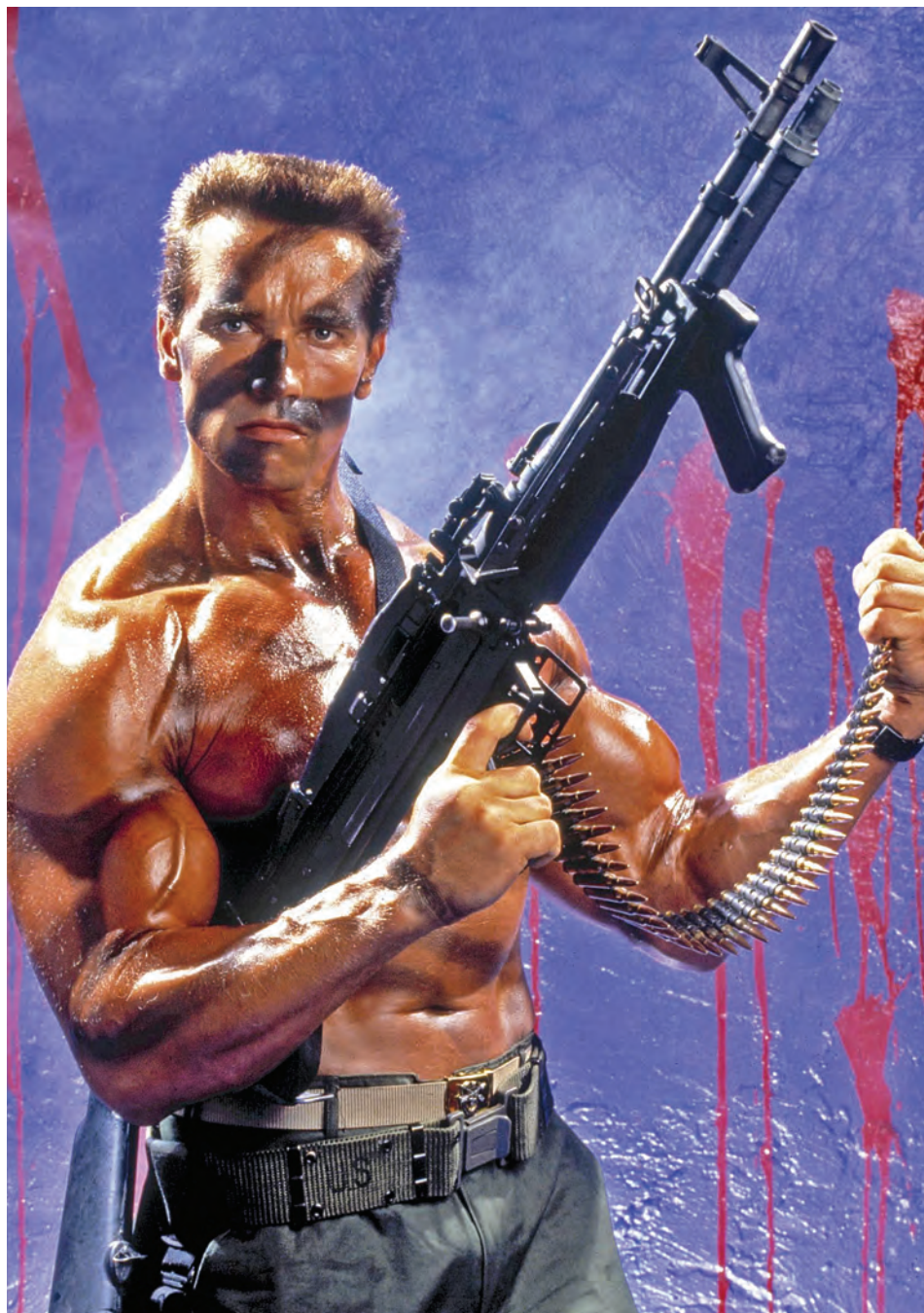
Komando [Commando], 1985