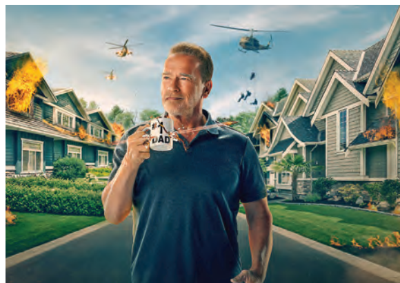
nahoře: Terminátor: Temný osud ( Terminator: Dark Fate ), 2019 / dole: FUBAR , 2023