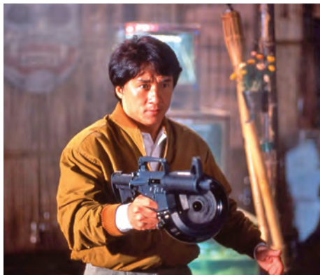
Jackie Chan se snažil do Hollywoodu probjovat několikrát, definitivně se mu to povedlo až koncem devadesátek. Série Křížovka smrti byla kasovním úspěchem. Na snímku Chan ve filmu Police Story 3 (1992).