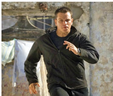
Matt Damon jako civilní hrdina Jason Bourne. Agent, co si nepamatuje, že je agent, přinesl do žánru autenticitu, ale také roztřesenou kameru režiséra Paula Greengrasse. Na fotce Bourneův mýtus (2007).

Jackie Chan nebo Jet Li vraceli domů, Čína již přebírala otěže. Oscarový Tygr a drak (2000) byl jednou z posledních koprodukčních vlašovek, než převládl pevninský filmový průmysl.