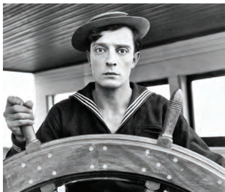
Buster Keaton zažil zlaté období až ve dvacátých letech minulého století, ale jeho Frigo, často vlající ve víchru nešťastných příhod, je spolu s Chaplinovým Tulákem typickým zástupcem akčních grotesek.