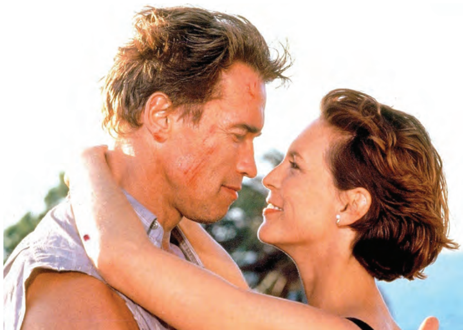
nahoře: Terminátor 2: Den zúčtování (Terminator 2: Judgment Day), 1991 / dole: Pravdivé lži (True Lies), 1994