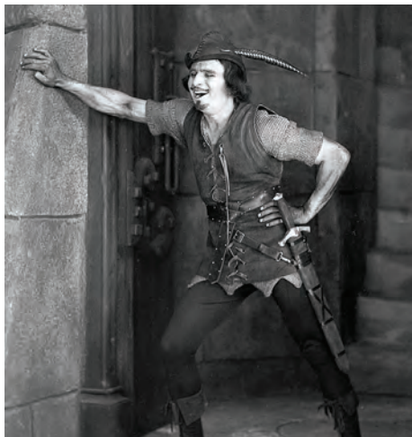
Douglas Fairbanks jako Robin Hood (1922) byl urostlý, obratný a šarmantní, přesně jak se na zbojníka milovaného prostým lidem sluší. S nástupem zvuku a středního věku však musel předat kord mladším.