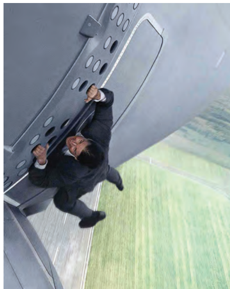
Tom Cruise jako agent, co plní nespílitelnou misi do roztrhání těla. Už ho možná trochu dohání věk, ale příštím generacím neúnavně ukazuje, jak se to má dělat. Na fotce Mission: Impossible – Národ grázlů (2015).