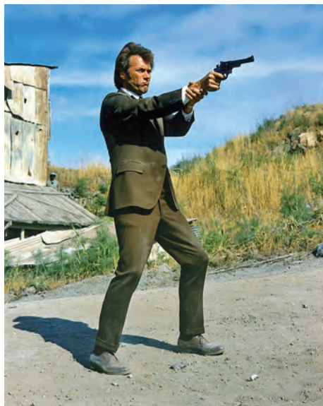
Drsný Harry Clint Eastwooda byl typickým antihrdinou, ale nebyl sám. Úspěšných filmových sérií se dočkal i Charlie Bronson s Přáním smrti nebo Burt Reynolds s pašeráky Gatorem a (později) Banditou .

a lichá (1978) nebo Hroši v Africe (1979). Díky špičkovému týmu kaskadérů jejich rvačky „dva proti všem“ bavily publikum skoro dvacet let.