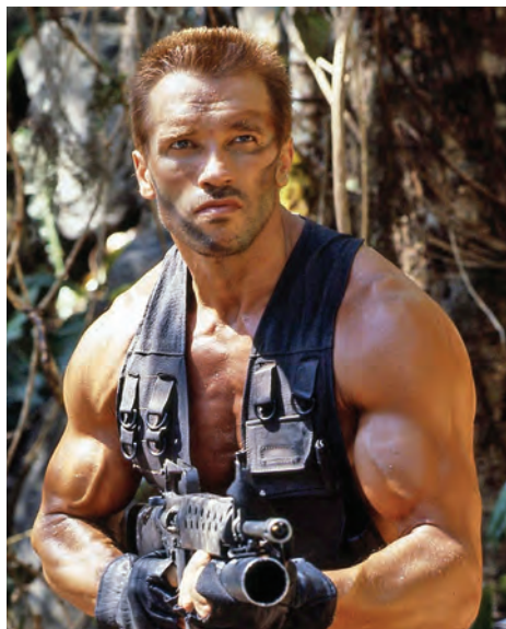
Arnold měl proti Slyovi zpoždění, ale díky filmům jako Komando (1985), Predátor (1987) nebo Rudé horko (1988) vše rychle dohnal. Fanoušky bavilo, že charisma a smysl pro humor má snad ještě větší než bicepsy.