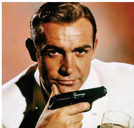
Po urostlých vojácích a antických hrdinech ze sandálových filmů (Steve Reeves v italských filmech o Herkulovi), se prosadil Sean Connery jako agent, který řeší problémy s pomocí intelektu a moderních hraček.