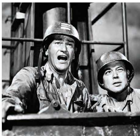
V písku ostrova Iwo Jima, Stíhací eskadra divokých koček nebo Operace Pacifik (na fotce). John Wayne vyměnil klobouk za helmu a přesvědčivě odehrál několik akčních velitelů, pilotů a machrů z druhé světové.