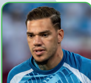
Ederson MANCHESTER CITY