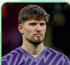
Gregor Kobel BORUSSIA DORTMUND