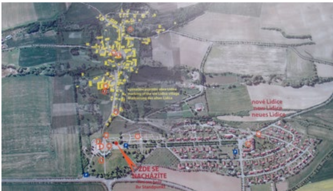
Plánek se znázorněním původních i současných Lidic

dy kostela, školy, velkorysý památník Lidice s muzeem, obnovený hřbitov. Stojí zde celá řada betonových plastik, růžový sad s růžemi z celého světa a lipová alej, která spojuje pietní území původní obce s novými Lidicemi. Poblíž obnoveného rybníka stojí jediný původní strom z Lidic, hrušeň. Nacisté ho nechali stát, protože se domnívali, že je suchý.