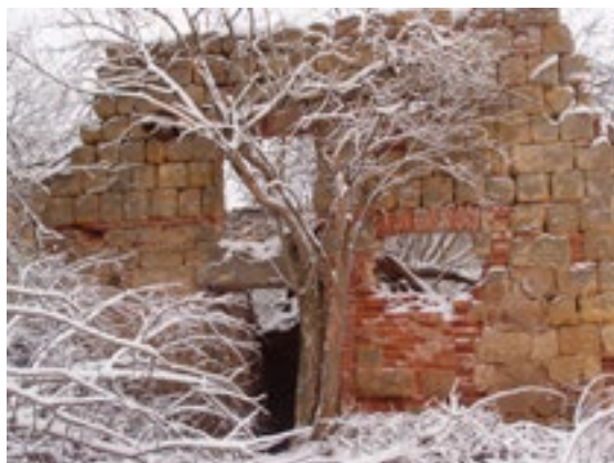
Část rozpadající se usedlosti Nový Dvůr

V roce 1842 se seznámil na žofínském plese s Boženou Němcovou. Ihned mezi nimi vznikla oboustranná náklonnost. Vidali se na vlasteneckých schůzkách a výletech. Po jedné takové procházce napsala Němcová svoji první báseň, věnovanou českým ženám, která vyšla 1. dubna 1843 v Květech. Božena Němcová díky tomuto romantickému vzplanutí začala psát, započala se její umělecká dráha. Vztah byl intimní a budil pohoršení české společ-