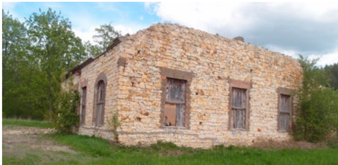
Zbytky posledního domu v Pecínově

Zůstala jen horní část, zvaná Vobíralka, která náleží k Novému Strašecí. Není však původní, vznikla ve 30. letech 19. století a s dolní osadou nebyla ani urbanisticky spojena. Dnes v místě bývalé vsi najdeme kromě Českých lupkových závodů jen široké cesty, delší zídku u cesty a ruinu velkého domu. A bujnou vegetaci.