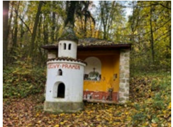
Bývalé lázně Boží Voda

Místo získalo na oblibě, stalo se cílem procházek mnohých obyvatel z města i okolí. Největší obliby dosáhla Boží Voda v 19. století. Fungoval zde hostinec, později došlo k rozšíření lázeňského domu, založení ovocného sadu,