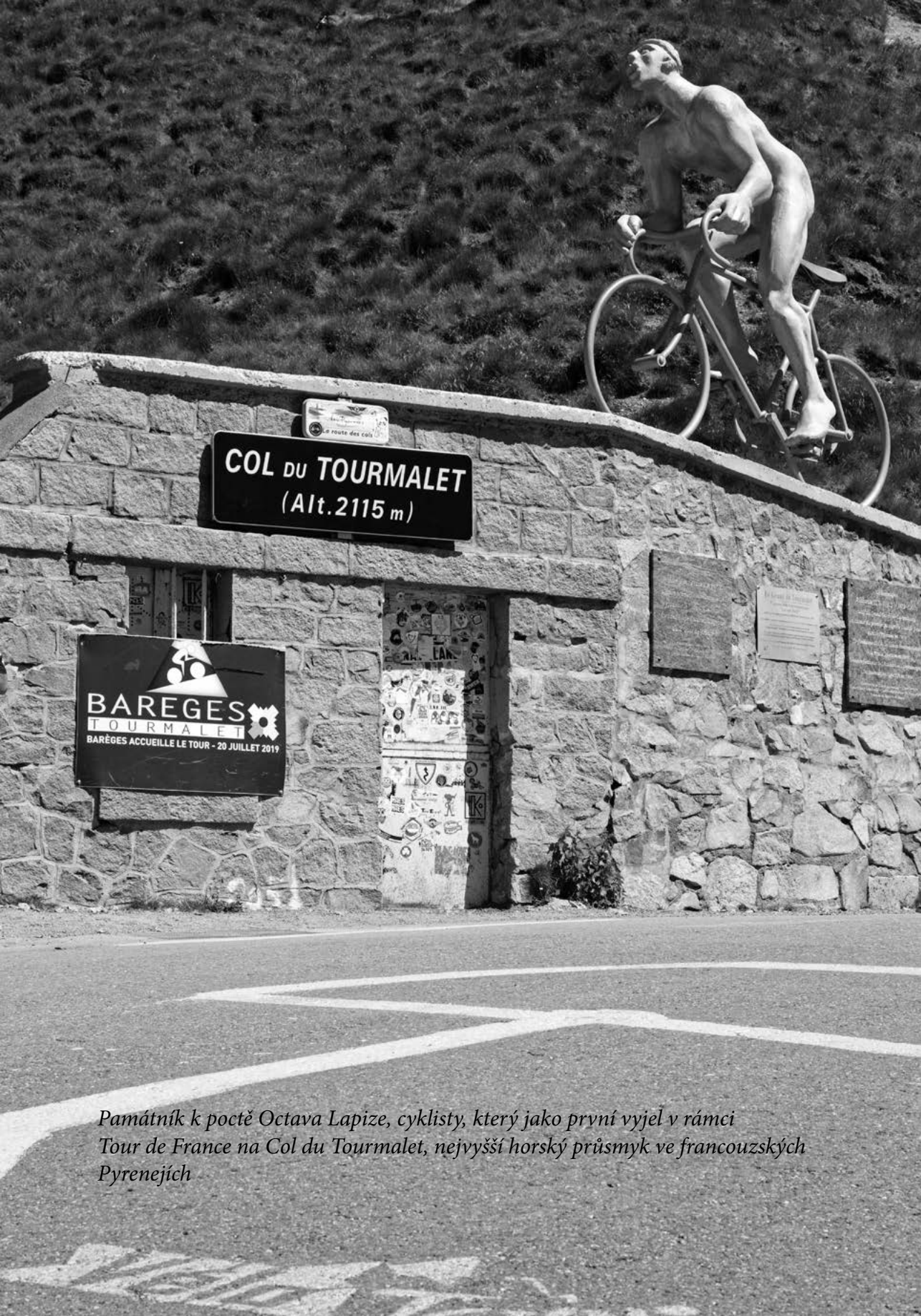
Památník k počtě Octava Lapize, cyklisty, který jako první vyjel v rámci Tour de France na Col du Tourmalet, nejvyšší horský průsmyk ve francouzských Pyrenejích