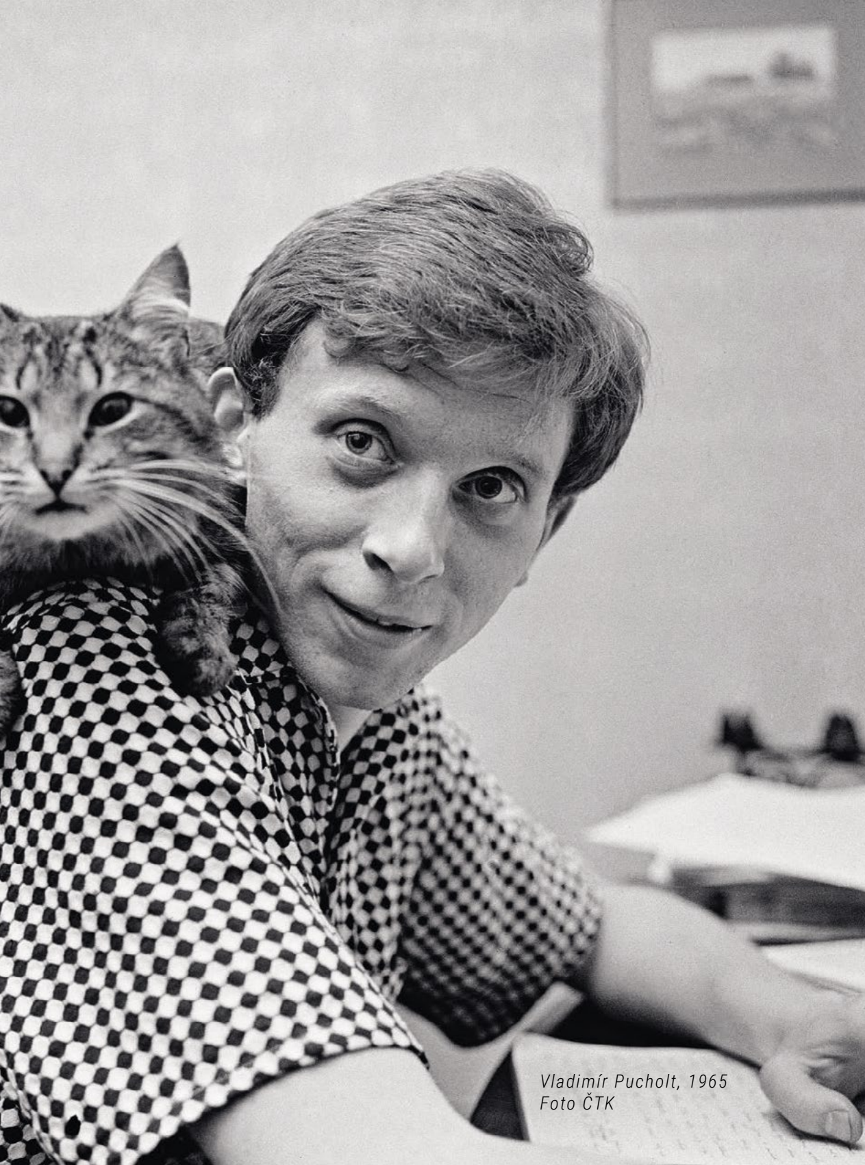
Vladimír Pucholt, 1965