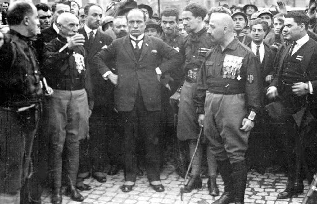
Mussolini po příjezdu do Říma v říjnu 1922. Za několik málo hodin jej čeká schůzka s králem a pověření sestavit novou italskou vládu.

rozhodnut vládnout. Dvacet šest tisíc mužů v černých košilích se 28. října 1922 vydalo na pochod do Říma. Armáda je mohla zastavit, ale většinou s nimi sympatizovala. Král Viktor Emanuel III. příkaz k odporu nevydal, prý se obával občanské války. Zato pověřil Mussoliniho sestavením vlády.