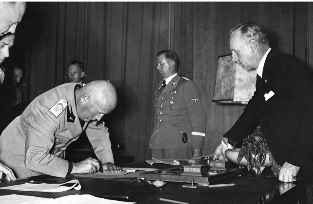
Duce podepisuje mnichovskou dohodu.

Mussolini je pak na mnichovské konferenci představil jako svůj vlastní zprostředkovací návrh. Při jednání se snažil hrát „první housle“. Zvláště Hitler byl jeho vystupováním silně ovlivněn. Tady je svědectví jednoho z účastníků schůzky: