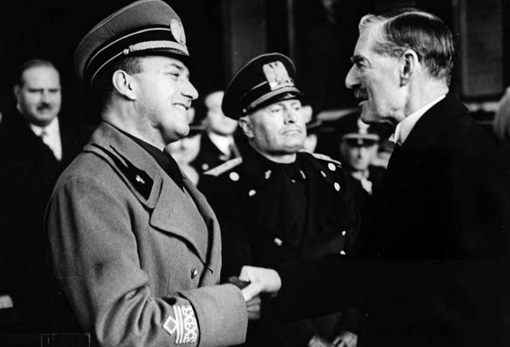
Mussoliniho zeť Galeazzo Ciano (vlevo) na předválečném snímku s ducem a britským premiérem Chamberlainem. Po italsko-habešské válce se stal ministrem zahraničí. A v roce 1940 vyhlásil válku novou – Británii a Francii.

vstal – po celou dobu, co Galeazzo diktoval, seděl chladně, skloněn nad papírem –, stiskl mu ruku a zamířil ke dveřím. Pak vyšel, aniž se obrátil.