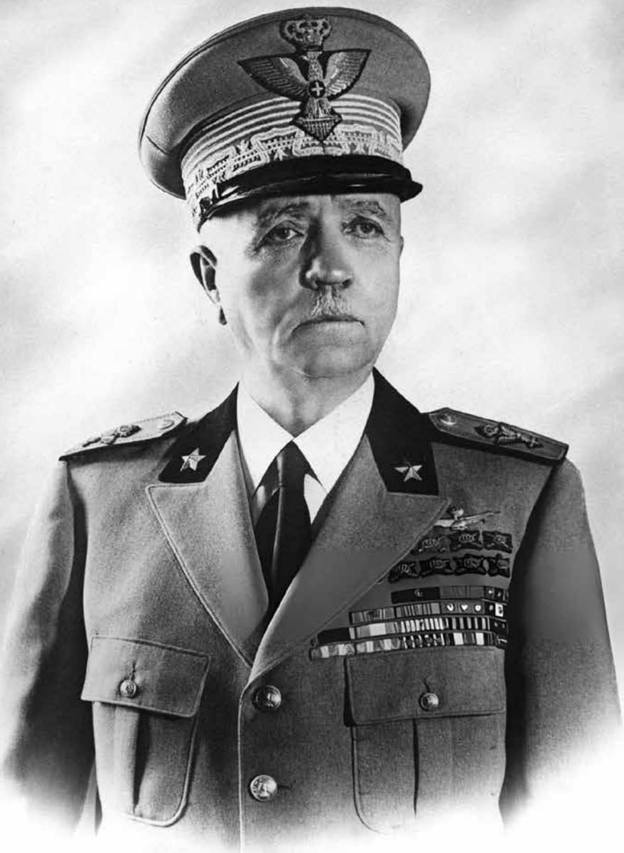
Pietro Badoglio – maršál, který měl rozhodující podíl na dobytí Habeše v letech 1935–1936, se měl na podzim roku 1943 stát novým italským premiérem.