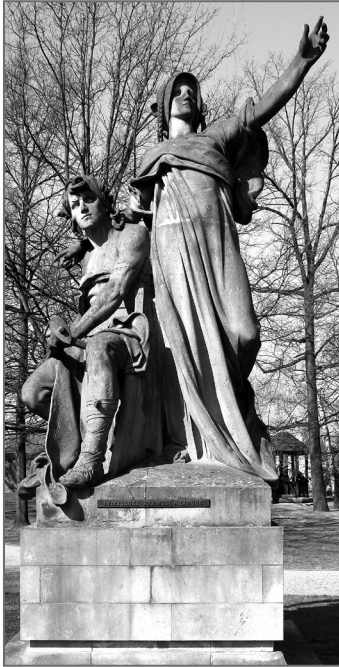
Sousoší Libuše a Přemysl od J. V. Myslbeka (1890) na Vyšehradě

„Hluboko na dně spočívej, kolébko mého syna, až čas tě opět povolá. Nebudeš na věky v temných hlubinách, nebudeš nad vlastní noc bez konce. Vzejde zas jasný den, vzejde zas blaho mému národu. Očištěn útrapou, sílen láskou a prací vztyčí se v síle, splní své tužby a dojde zas slávy. Tehdá zas ze tmy vod vysvítíš, na světlo vyplyneš a vlastní spása, před věky souzená, spočine na tobě, jsouc ještě dítětem.“