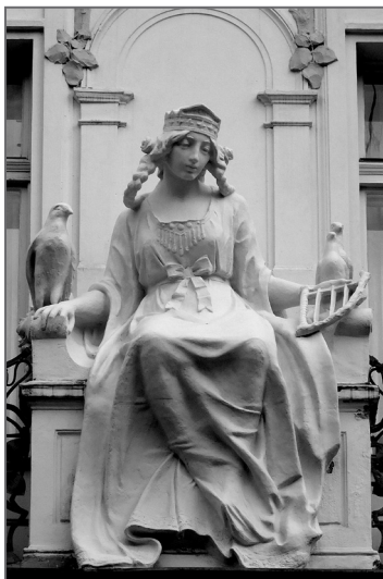
Socha kněžny Libuše v Karlově ulici v Praze

způsob delfína, mořského vepře, směrem až k řečené řece. Až přijdete, naleznete člověka, an uprostřed lesa teše práh domu. A protože se u nízkého prahu i velcí pánové sklánějí, podle této příhody hrad, ježž vystavíte, nazvete Prahou. V tomto hradě někdy v budoucnosti vzejdou dvě zlaté olivy, jež svými vrcholy proniknou až do sedmého nebe a po všem světě budou zářiti svými divy a zázraky. Budou je obětmi a dary ctíti a jim se klaněti všechna pokolení země české a ostatní