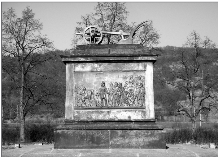
Pomník Přemysla Oráče na Královském poli ve Stadicích

Zajímavá je v tomto příběhu role železa, a to v podobě Přemyslovy železné radlice. Kosmas toto téma do svého vyprávění vůbec nezahrnul. Tzv. Dalimil vypráví, jak Přemysl vyňal z lýkové mošny ke snídani chléb a sýr (toto