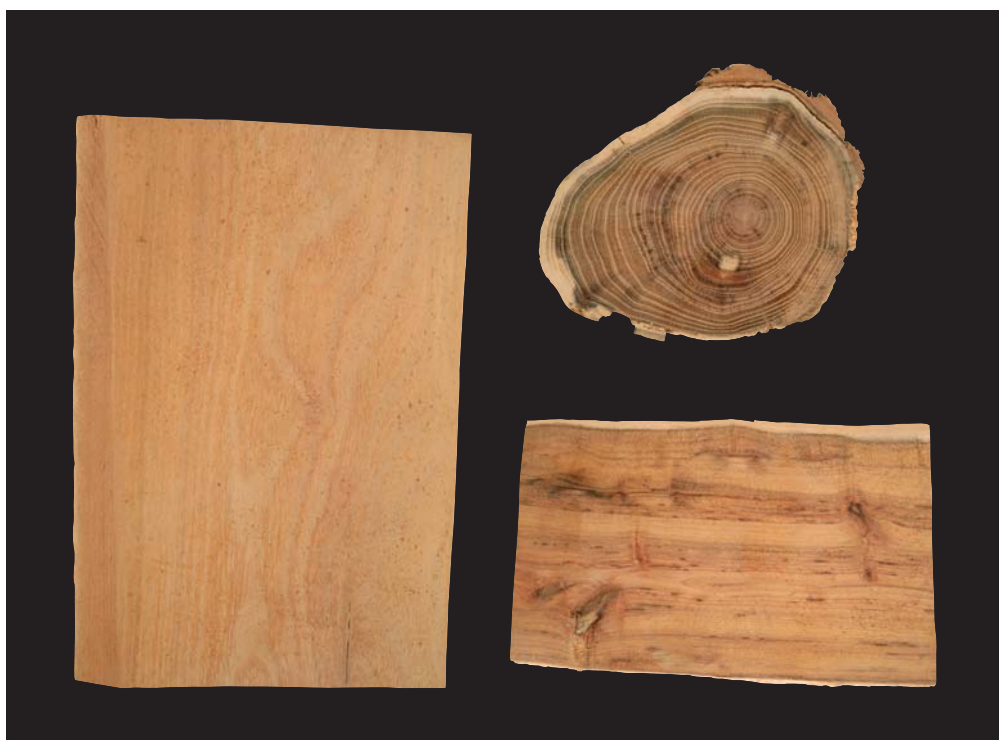
Trnovník bílý, akát ( Robinia pseudoacacia )