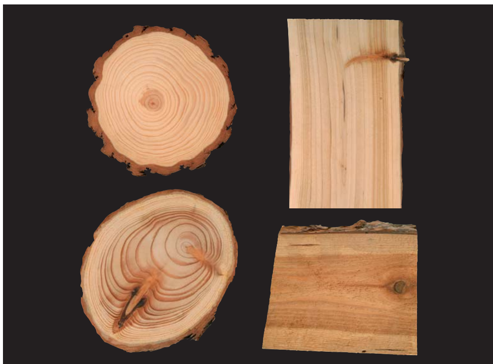
Modřín opadavý ( Larix decidua )