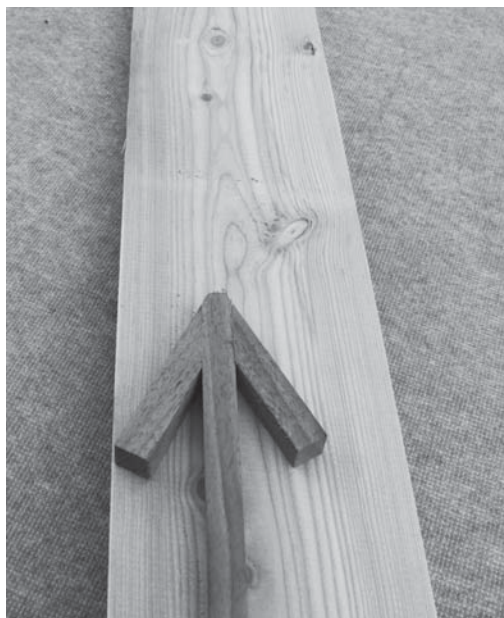
Obr. 3 Směr růstu stromu

Při jakémkoli obrábění postupujte od kořene do koruny (viz obr. 3 ) - ne v opačném směru. To platí při osekávání větví, při řezbě dláty či hoblování. U prkna či fošny některých dřevin lze ze dřeva směr vláken dobře vyčíst.