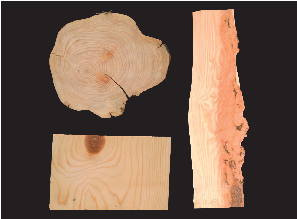
Smrk ( Picea )