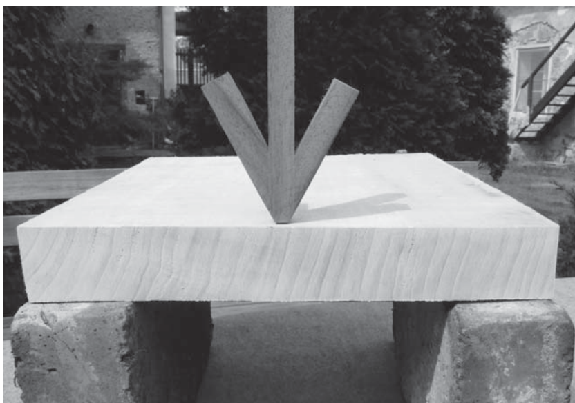
Obr. 1 Nejmenší pevnost

Pomůže vám to mimo jiné k pochopení pevnosti dřeva. Vidíte v krajině vysoký strom, jak se kymácí v prudkém větru a jen málokterý se zlomí. Takže v podélném směru je dřevo nejpevnější (viz obr. 1 a 2).