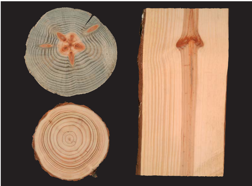
Borovice ( Pinus )