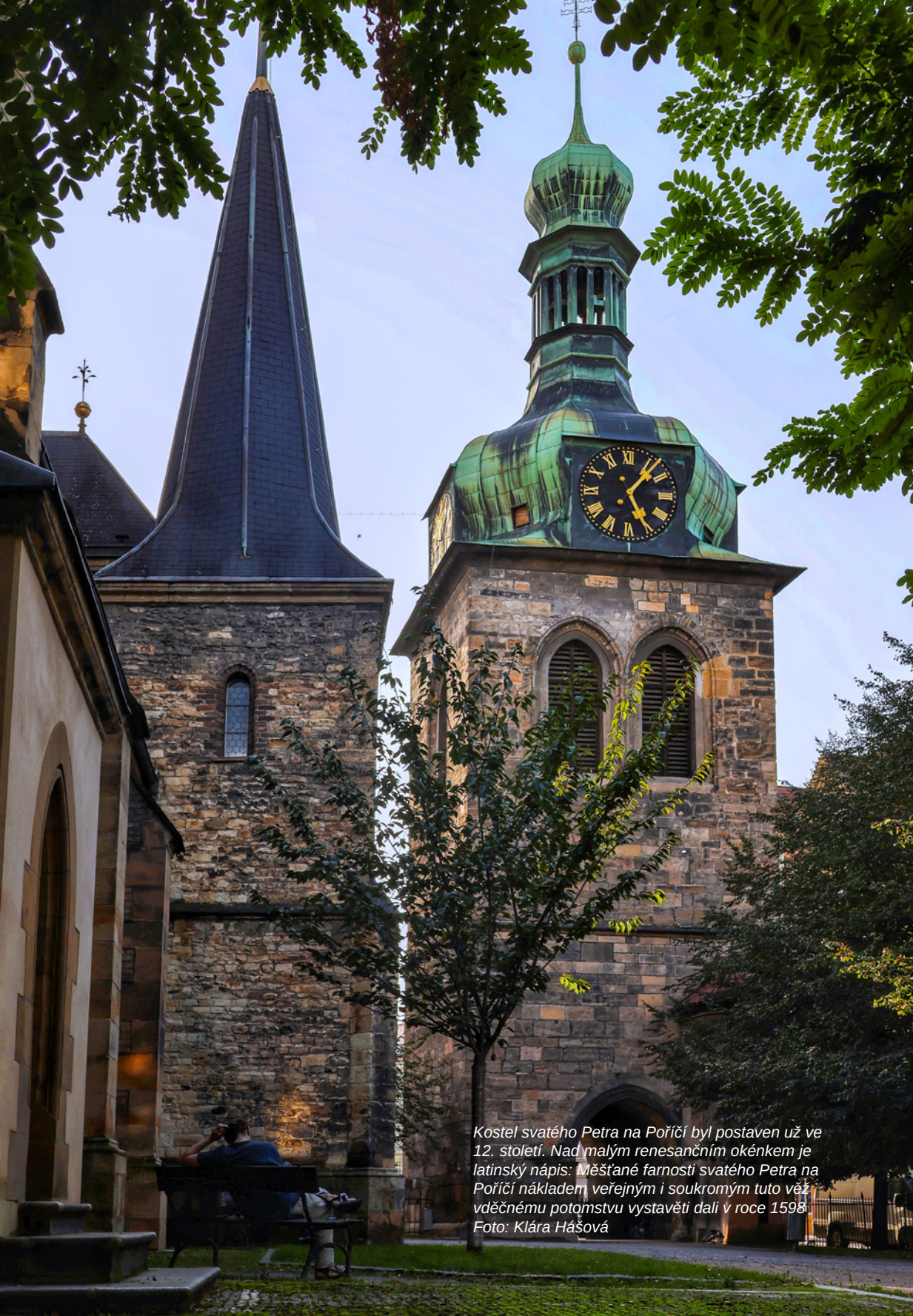
Kostel svatého Petra na Poříčí byl postaven už ve 12. století. Nad malým renesančním okénkem je latinský nápis: Měšťané farnosti svatého Petra na Poříčí nákladem veřejným i soukromým tuto věž vděčnému potomstvu vystavěti dali v roce 1598.