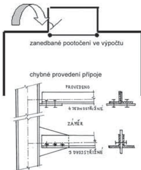
Obr. 2.1 Schéma přípoje havarované haly

Výpočty ocelových konstrukcí byly v té době prováděny ručně na logaritmickém pravítku s přesností cca 3 %, což stále ještě plně postačuje pro většinu konstrukcí. Jako metoda řešení vnitřních sil se pro ocelové konstrukce používala většinou silová metoda, vzhledem k obvykle nízkému stupni statické neurčitosti. Pro železobetonové konstrukce se naopak většinou užívala deformační metoda, vzhledem k většímu stupni neurčitosti tuhých rámových železobetonových konstrukcí. Pokud byla použita deformační metoda, mohlo dojít při zanedbání některých přetvoření (s cílem snížení počtu neznámých) a při event. další konstrukční chybě i k havárii konstrukce. Statik, který navrhoval obvykle železobetonové konstrukce, použil deformační metodu i pro výpočet ocelové rámové vazby, zanedbal natočení sloupku styčnicku a navrhl 3 šrouby pro přípoj táhla ze dvou úhelníků. Tento přípoj detailně nezakreslil a nezapsal, že uvažuje únosnost dvojstřížných šroubů . Statický výpočet sloužil jako podklad pro konstruktéra ke zpracování prováděcích výkresů. Konstruktér navrhl 4 šrouby jednotřížné (místo statikem uvažovaných dvojstřížných šroubů) s přesvědčením, že provedl návrh dostatečně bezpečný. Ve skutečnosti byl výsledný přípoj schopný přenést pouze 2/3 vypočtené síly v táhle ( obr. 2.1 ).