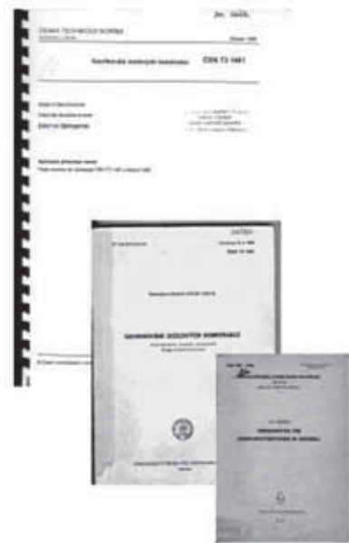
Obr. 1.1 Normy navrhování ocelových konstrukcí 1929–1998

V současnosti je velmi vzácný případ návrhu nosné konstrukce bez využití výpočetních programů. Doba výpočtů na logaritmickém pravítku při použití silové nebo deformační metody již nenávratně minula (obr. 1.2). Od sedmdesátých let se používají pro výpočty vnitřních sil resp. napjatosti v konstrukci výpočetní programy na sálových počítačích založené na metodě konečných prvků. Od rozšíření osobních počítačů (tj. cca od roku 1990) se používají tyto programy zcela masově. Ve světě i u nás jsou v běžné inženýrské praxi používány převážně programy řešící konstrukce s materiálově lineárním chováním (např. FEAT, NEXIS, FIN, STRAP, STRUDL, SAP, RSTAB, SCIA ENGINEERING (dříve ESA), SPACE FRAME).