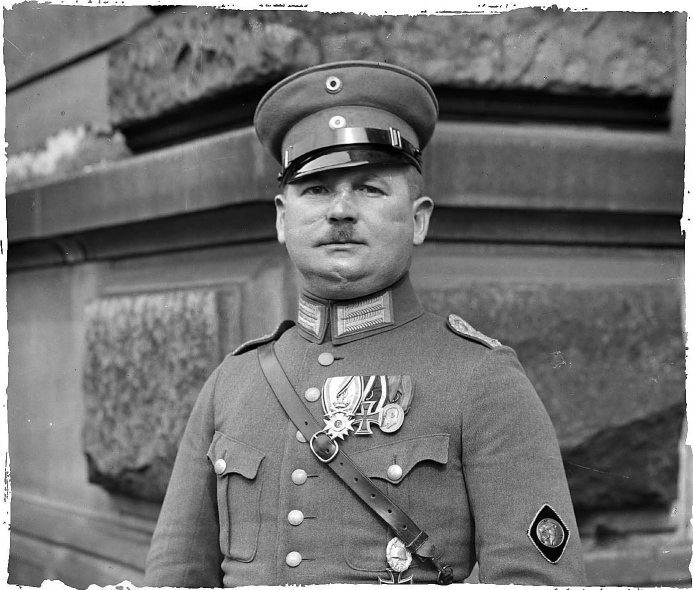
Ernst Röhm, jehož cílem bylo odstranit Hitlera a zaplatil za to životem.

skupiny, jež působily v okolí Mnichova (a které následujícího měsíce vytvořily krátce existující Bavorskou republiku rad). Ať už byl účel jejich setkání v tmavé sklepní pivnici jakýkoli, Hitler později vzpomínal, že rychle našli společnou řeč a celý večer debatovali o způsobech, jak bojovat proti levicově zaměřenému revolučnímu hnutí, které pozorovali kolem sebe. Oba sdíleli šířavou nenávist k nové demokratické Výmarské republice a „listopadovým zločincům“ ve vládě, o nichž byli přesvědčeni, že nesou odpovědnost za kapitulaci jejich země, která znamenala konec války. Shodli se na tom, že k vybudování silného, nacionalisticky orientovaného Německa je zapotřebí nová politická strana, jež by rekrutovala členy z nižších společenských vrstev.