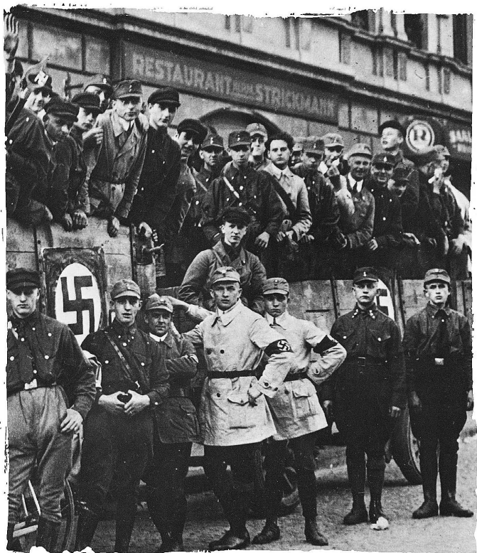
Příslušníci SA ve dvacátých letech. Vynesli sice Hitlera k moci, ale pak bylo třeba je zkrotit.

a SS nepřipustí, aby německá revoluce ustrnula a byla uprostřed cesty zrazena těmi, kteří se nezapojili do boje. A to ne kvůli SA nebo SS, ale kvůli Německu. SA je poslední ozbrojenou silou našeho národa, která ho může bránit proti komunismu.“ V průběhu následujícího roku uchwátí Hitler v Německu absolutní moc, avšak pokud Röhm čekal, že se mu dostane odměny za věrnost, byl zklamán. Jeho soupeři, jako například Himmler, získali v novém režimu prominentní postavení, Röhm však zůstal na místě