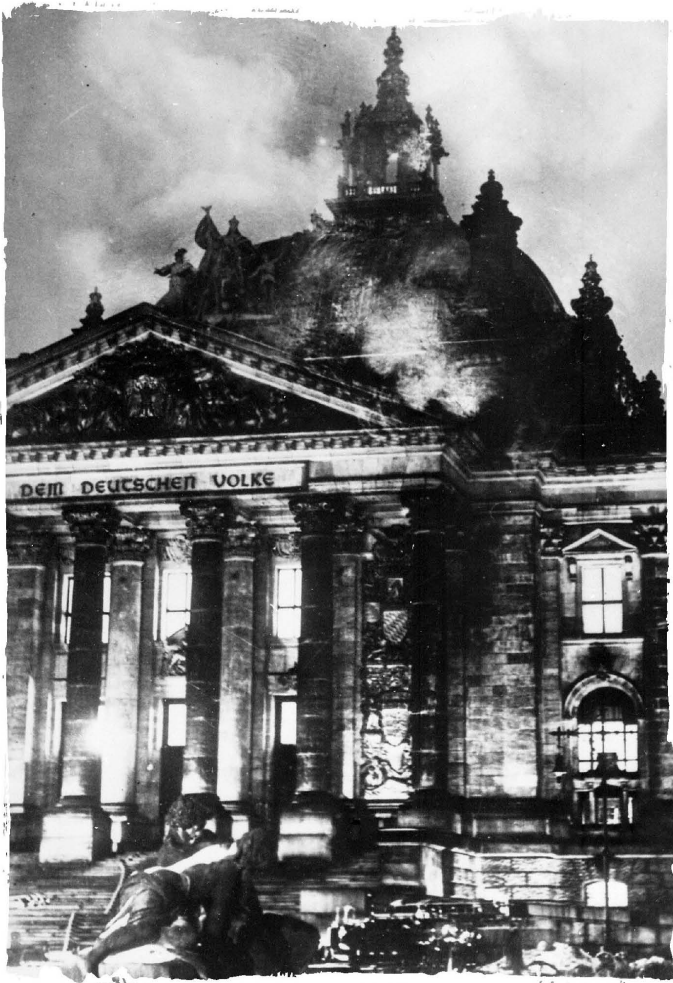
Požár Reichstagu – komunistické spiknutí, nebo dílo SS?

plánoval zahájení války, důležitější pro něj bylo získat oporu v armádě. V průběhu první fáze čistky v SA, jež započala