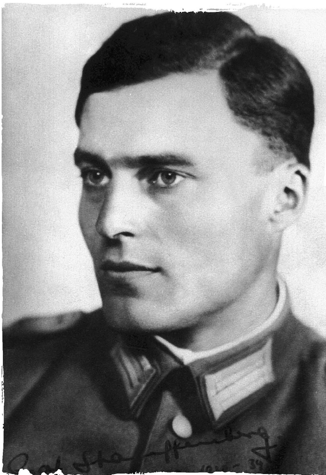
Claus von Stauffenberg, muž, který bezmála zabil Hitlera.

Von dem Bussche se nenechal odradit a hlásil se, že provede útok při další příležitosti, jakmile dojde na předvádění nových uniforem v únoru 1944, jenže stejně jako Tresckow byl i on převelen na východní frontu dřív, než se kýžená