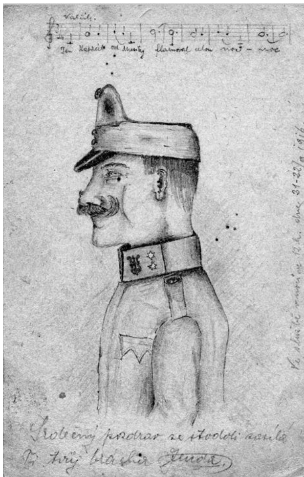
Autoportrét na feldpostce z fronty

Celou publikaci doplňují feldpostky zasílané Janem Příbylem (podrobněji na str. 116-117).