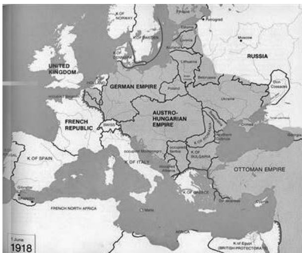
Großdeutschland – Velkoněmecko podle plánů v roce 1918