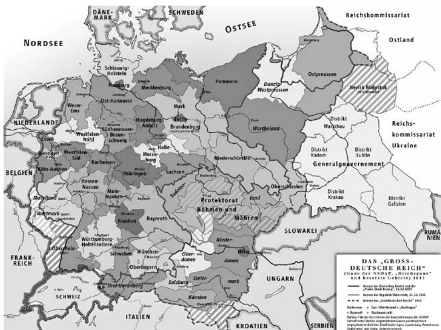
Mapa Velkoněmecké říše 1943 dle NSDAP