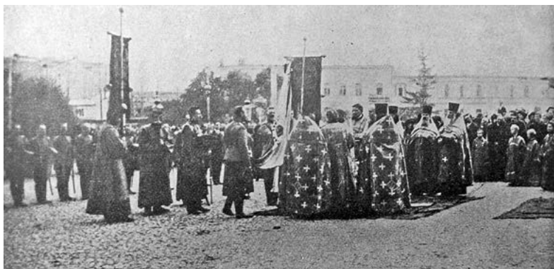
Pravoslavný obřad svěcení praporu při slavnostní přísaze České družiny na Sofijském náměstí v Kyjevě, když předtím zástupci Čechů jednali s carem Mikulášem o vytvoření „Československého království“.

ka a Rakouska bude ohrožena existence českého národa v Čechách i na Moravě a také dojde k praktickému zničení nepočetného slovenského národa stále více se nacionalisticky fanatizujícími Maďary.