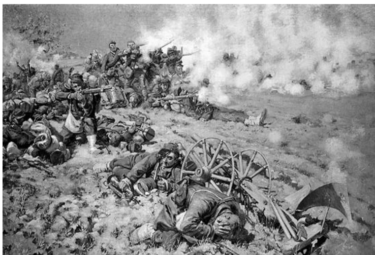
Bitva u Mars la Tour, 1870

Že to nebylo myšleno obrazně, ale doslova, o tom svědčí obraz Bitva u Mars la Tour 1870, který byl pro Němce čímsi jako pro Čechy obrazy husitských vojsk vyhánějících „Němce-papežence“ od Mikoláše Alše.