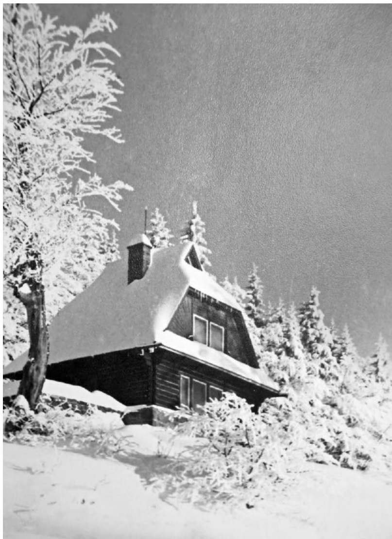
Zasněžená roubená chalupa v Beskydech. Raszkův domov i ateliér.