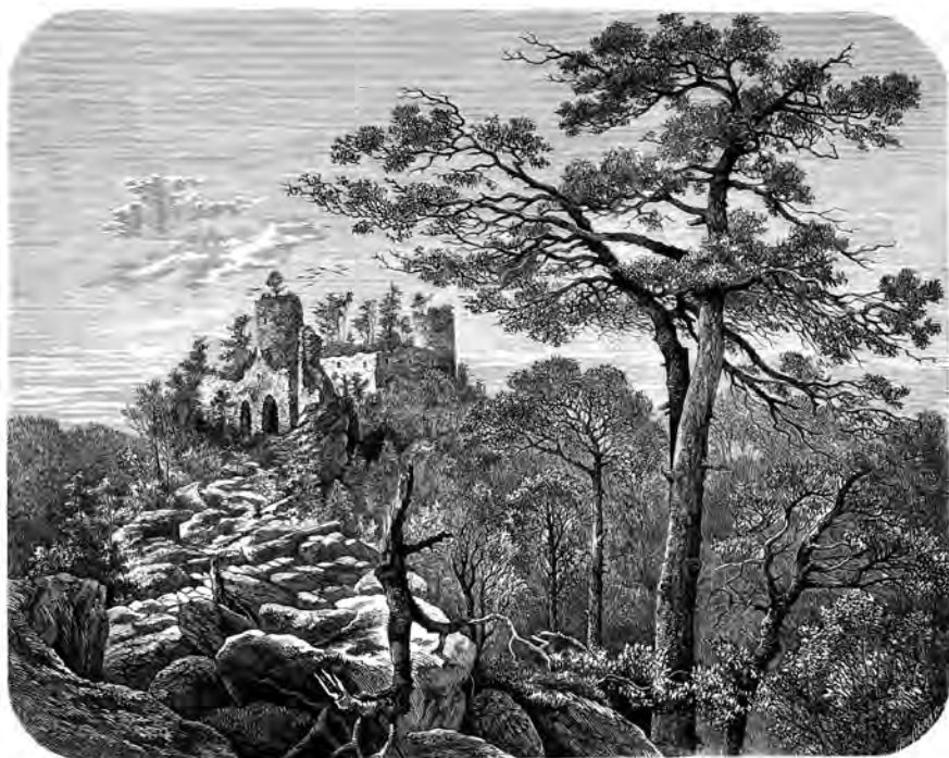
Zříceniny hradu Valdeka na dobové pohlednici

Jako ostatní naše hrady má i Valdek svoji pověst o bílé paní. Vypadá jako mladá dívka, má dlouhé, vlnité blond vlasy, které jí dosahují až na ramena. Oblečena je do průsvitných bílých šatů. Můžeme ji spatřit za slunného jarního dne v pravé poledne pod hradem, jak poskakuje svýma bosýma nohama po sluncem vyhřátých balvanech, směrem od potoka ke hradu. Když je někým pozorována, svůj pohyb zrychluje a postupně se ztrácí. Asi