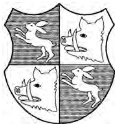
Erb Zajíců z Valdeka

Oldřich Zajíc z Valdeka měl za první manželku Bohuslavu z Komárova. Po její smrti se znovu oženil a druhou jeho manželkou se stala Eliška ze Svinař. Oldřich byl purkrabím na královském hradě Lokti (což znamenalo, že byl správcem oblasti severozápadních Čech). Později se stal purkrabím Pražského hradu. Kromě hradu Valdeka založil i klášter Na Ostrově (později nazýván klášter sv. Dobrotivé) a získal hrad Žebrák (jeho potomci se již psali „ze Žebráku“).