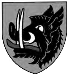
Erb rodu Buziců

„V bráně se opět ohlédl, on a všichni se pak ohlíželi vzhůru po bráně, po břevnu nad ní, na němž trčela useknutá veliká hlava divokého kance, jehož včera skolil. Černala se, štětinatá, mohutného rypáku, ceníc bílé lesklé tesáky a připomínala sílu Bivojovu.“