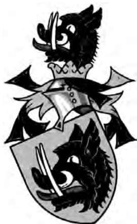
Erb rodu Buziců