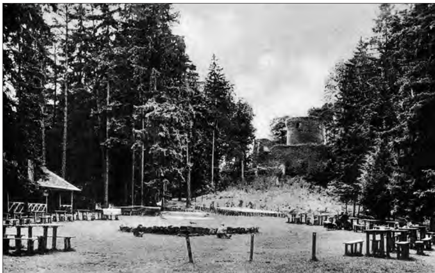
Předhradí Valdeka (vlevo tzv. dupárna)

Hrad byl zbudován na ostrohu a ze tří stran je chráněn prudkými srázy ohromných balvanů. Na severozápadní straně je zachován vně hradeb navíc příkop a násep složený z kamenů, bez použití malty, což svědčí o tom, že hrad byl vybudován na místě, které bylo již dříve v minulosti opevněno.