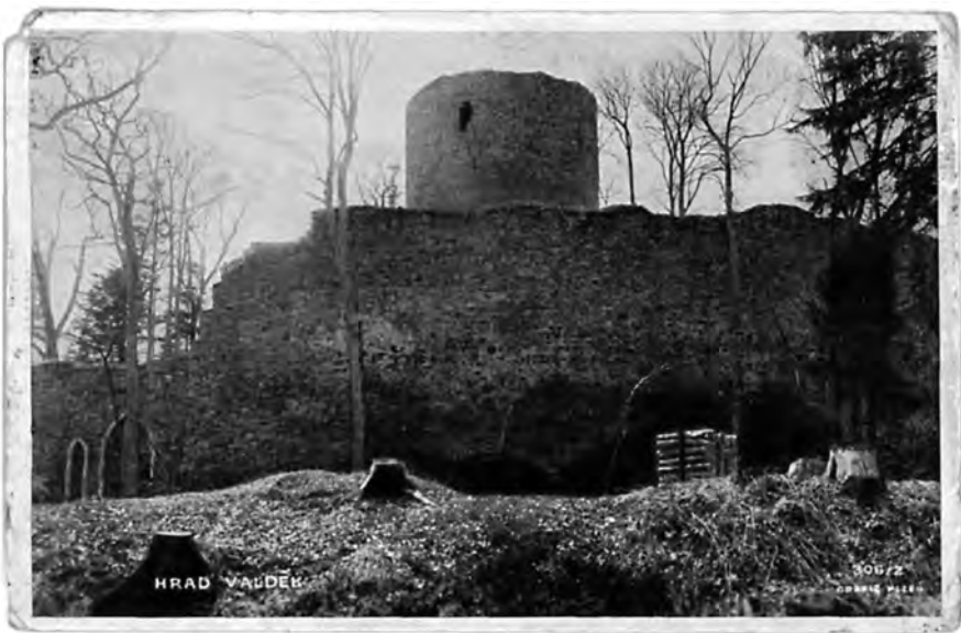
Zříceniny hradu Valdeka na dobové pohlednici

Vstoupila do branky, prošla potichu okolo věže a při vstupu na nádvoří zůstala překvapena. Vlevo byla hradní kuchyně a přímo proti ní veliká