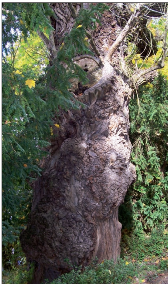
Jeden z nejstarších stromů v zámeckém parku Konopiště. Detail kmene topolu kanadského. Krásně utvářená kůra tohoto stromu vypovídá o jeho stáří