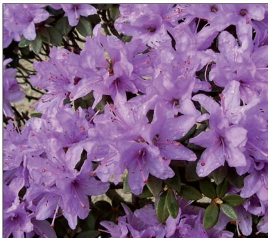
Azalky se pěstují především pro květy

Mimo mech se používají také doplňkové rostliny, přídavné kameny jako skaliska, šterky různé zrnitosti a všemožné doplňky (altánky, můstky, figurky lidí atd.). Pro bonsaje z našich stromů je však třeba dobře vybírat, jiné doplňky volí pro své dřeviny například v Japonsku a odlišné budeme používat my.