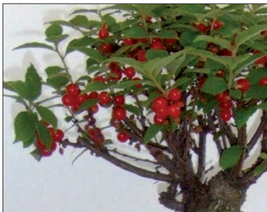
Plody na bonsajích je třeba redukovat na co nejmenší počet, aby stromek nestrádal (višeň plstnatá)