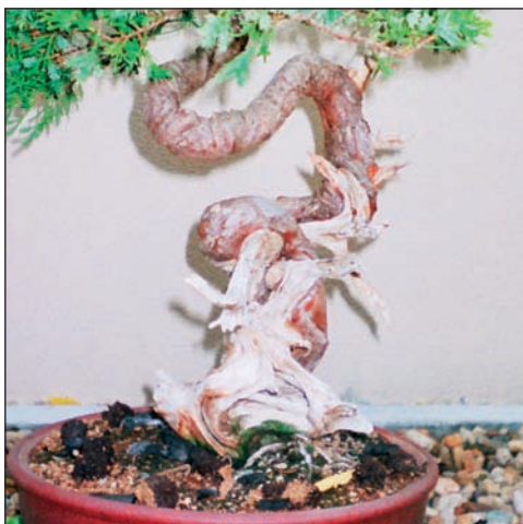
Kmen tohoto jalovce je sice pokroucený, ale přesto dobře utvářený. Navíc je použita technika mrtvého dřeva

Velikost listů u zdravé bonsaje je možné redukovat určitými zásahy. Nejúčinnější je tzv. odlistění . To znamená, že ve vegetačním období (nejlepší je polovina června) ostříháme rostlině část nebo i veškeré listy až po řapík. V úžlabí se probudí spící pupeny a na stromku se po pár týdnech objeví nové, menší listy. Tento zákrok můžeme provádět pouze u starších jedinců, kteří jsou dostatečně vyvinutí a v dobré kondici. U mladých stromků raději počkáme, protože je důležitější sílení kmene a větvení stromu.