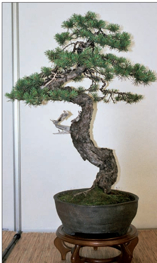
Bonsaj borovice s pokrouceným kmenem v literátském stylu zasazená v kulaté nádobě. Kresba této bonsaje je na str. 8

Pěstování miniaturních dřevin v miskách má dlouholetou tradici. Již před více než dvěma tisíci lety se v Číně používaly k výzdobě interiérů zakrslé dřeviny pěstované v mělkých nádobách. Japonští