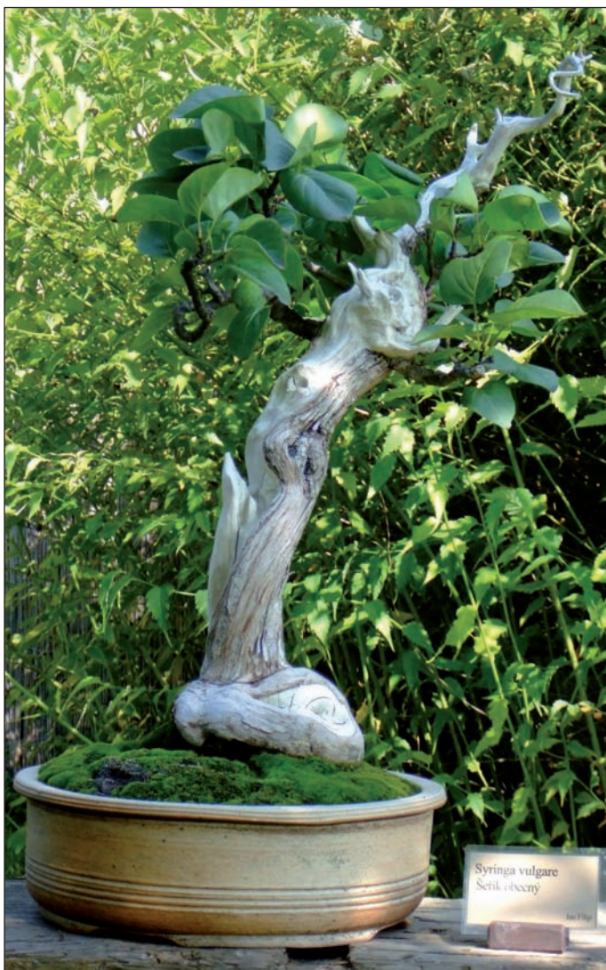
Krásný stromek tohoto šeříku je vypěstován ze staré rostliny technikou zakrácení kmene

V Evropě a západních zemích je tato tradice ještě poměrně mladá, vždyť první bonsaje dovezené z Japonska a Číny se zde objevily až koncem 19. století. Přesto toto umění zaznamenalo velký rozmach, jak v Americe, tak po celé Evropě. Existuje již mnoho klubů sdružujících fanoušky bonsají, a nutno podotknout, že za tak krátký časový úsek lze i u nás spatřit mistrovská díla.