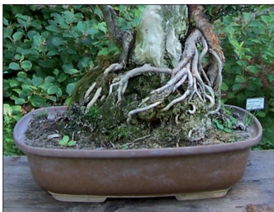
Povrch zeminy v misce je důležitým prvkem v celé kompozici bonsaje