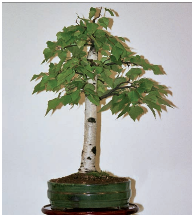
Bříza pěstovaná v přísně vzpřímeném stylu. Kmen je v celé délce přísně kolmý