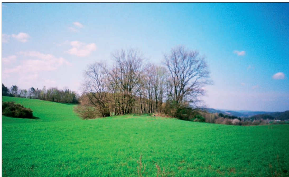
Remízky ve volné přírodě mohou být inspirací pro tvorbu lesíků a krajinek na mísách

Čiňané, u nichž má umění bonsají svou kolébku, používají pro pěstování i některé trvalky. Výběr květin je dosti široký. Pro naše účely jsou však nevhodné. Není u nich možná redukce velikosti a proporcí běžnými bonsajistickými technikami. Proto je hlavním kritériem jejich výběru dobrý proporcionální poměr k nádobě. Vlastní práce s „tvarováním“ se tak omezuje na volbu správné nádoby a umístění rostliny. Prosvětlujeme pouze ty rostlinné části, které jsou příliš velké nebo zakrývají květy. Pěstujeme tak některé kapradiny, bambusy a další.