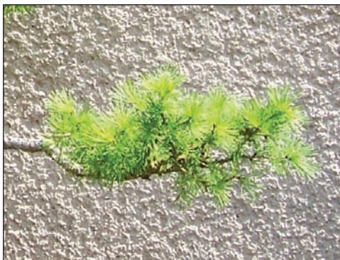
Jemné větvení je velmi důležité pro celkovou strukturu koruny. Proto je nutné v prvních letech pěstování stromek často stříhat