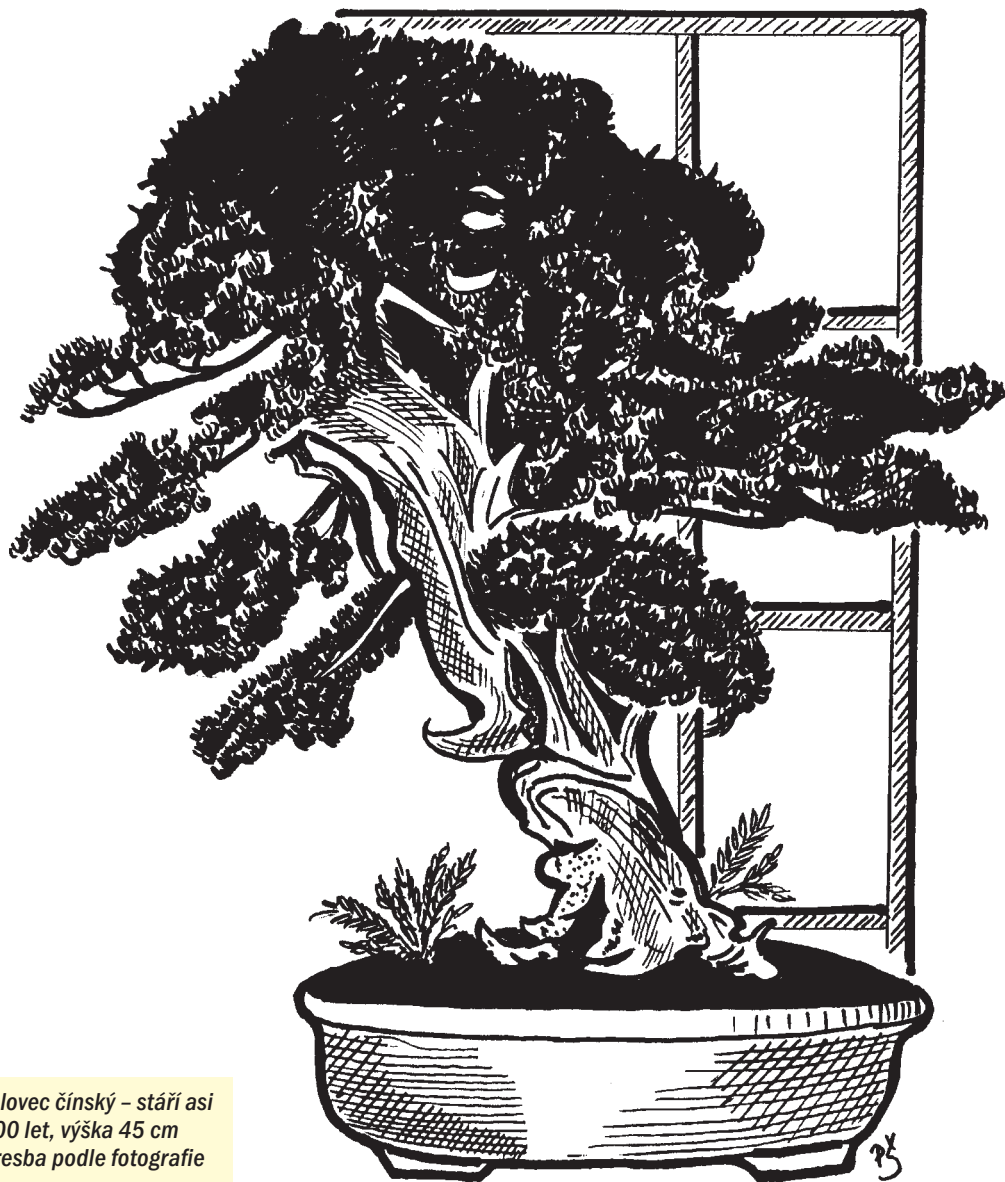
Jalovec čínský – stáří asi 300 let, výška 45 cm Kresba podle fotografie

pěstitelé vtiskli této zálibě pravidla, v průběhu staletí vytvořili různé techniky, propracovali technologii ošetřování a nechali vzniknout odvětví umění, které nemá obdoby. Dnes má v Japonsku stejnou prestiž jako sochařství nebo malířství. Miniaturní strom v misce je uměleckým dílem, navíc živým a stále se měnícím.