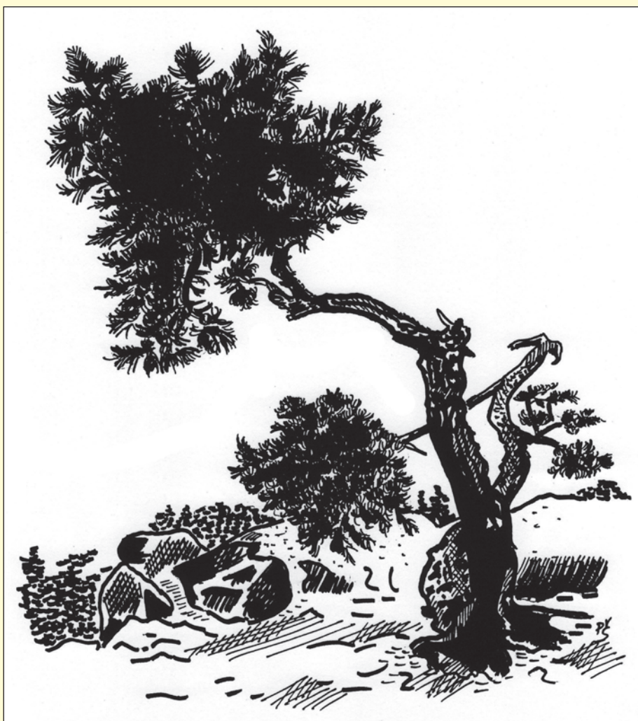
Borovice horská v přírodě