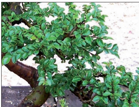
Drobné olistění je i výsledkem pravidelného zakracování větví. Jilm čínský je ideálním materiálem pro bonsaje