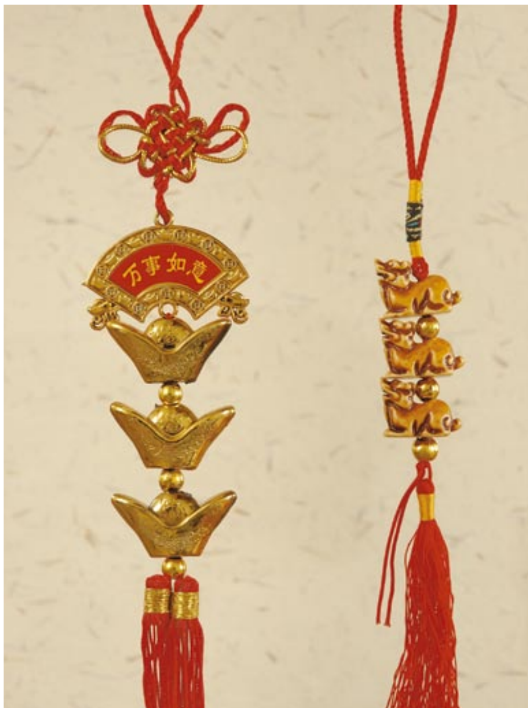
☞ upomínkové předměty pro neznalé turisty z prodejny rychlého občerstvení – i tak může dopadnout komerční verze tisícileté tradice