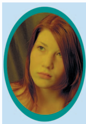
Obrázek 1.5: Portrét tvoří detail, který považujeme za uzavřený celek.

Princip role je uváděn jako základní kámen pro uspořádání prvků, tedy kompozici fotografického obrazu, která podporuje obsah snímku. Je-li prvek v obraze sám, je jeho role jiná, než když je součástí celku obrazu, kdy jednotlivé prvky vytvářejí vztah mezi sebou navzájem a mají vztah i k rámu obrazu.