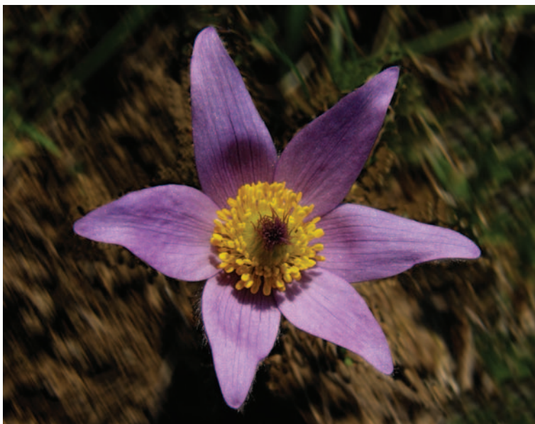
Obrázek 1.1: Figurou je reálný a ostrý květ.

Figura nemusí být na snímku celá, ale divák by měl mít možnost si její pokračování domyslet, pokud je to k pochopení obsahu snímku vůbec třeba.