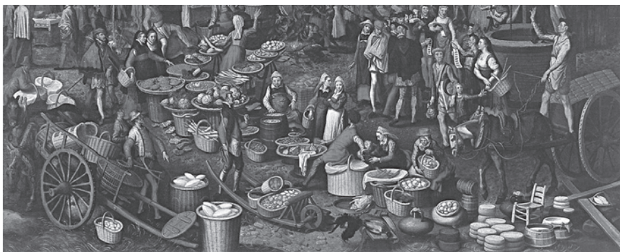
■ fotografie 1 Pieter Aertsen, „Trh“ (přibližně 1550)

Příkladem může být Brueghelův obraz „Kalvárie“, kde je zobrazená velká nůše s vikem zdobená korálky. Často se také stejné koše objevují na různých obrazech téhož malíře a je pravěpodobné, že patřily k souboru dekorací, které při tvorbě používal.