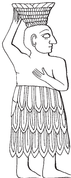
■ obrázek 2 Vyobrazení lagašského krále Urnanše s košem hlíny na hlavě

Bůh Enlil nakonec prosbu své matky vyplnil. Vytvořil zemi a nebe a potom vymodeloval z naplavené hlíny člověka, kterému určil, aby obdělával zemi. K tomu mu dal svou motyku na práci a koš na nošení plodů země.