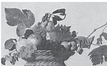
■ fotografie 2 Carravaggio, „Zatíší s ovocným košem“ (1601), koš v tažené technice

Mnohé materiály a techniky zemí na jihu Evropy jsou společné pro celé Středomoří. Ve středověku byla v Evropě velmi oblíbená tažená technika, která se zřejmě šířila z jihu. Koše v této technice najdeme na malbách a freskách po celé Evropě. Bohaté vzory se nazývaly madeira – snad podle ostrova Madeira, odkud se rozšířily na kontinent. Nejprve se s nimi můžeme setkat ve Španělsku, Portugalsku a Itálii.