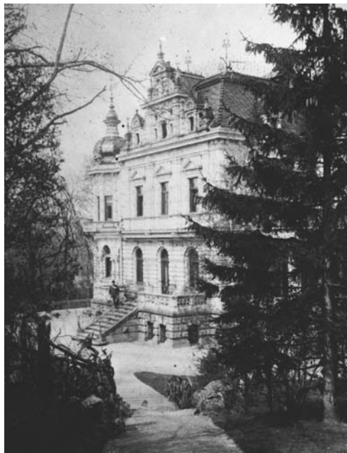
Vila Hielle na dobové fotografii