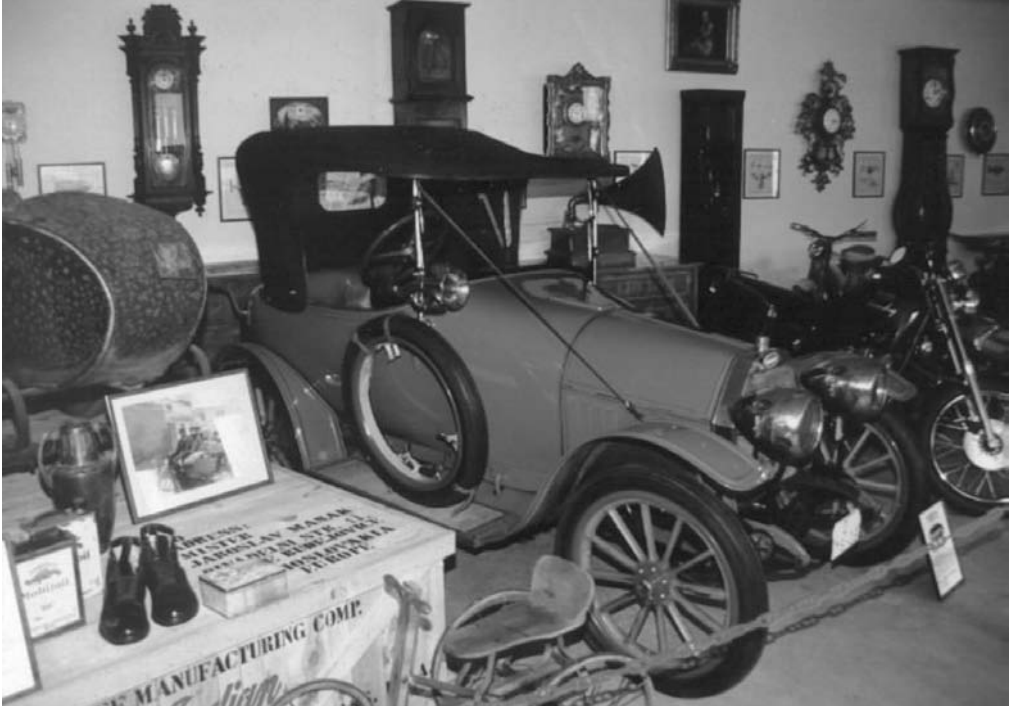
Vůz Bugatti 13, který patřil hraběti Buquoyovi, je dnes obdivovaným exponátem Jihočeského motocyklového muzea v Českých Budějovicích