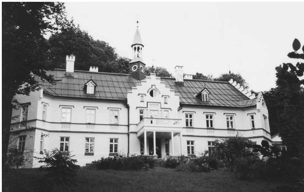
Zámek Buchenau

vá válka a Liebisch musel domů ke střeleckému pluku č. 9 v Litoměřicích, s nímž odešel do pole. Těhotnou manželku Herminu musel nechat u rodičů ve Zwieselu.