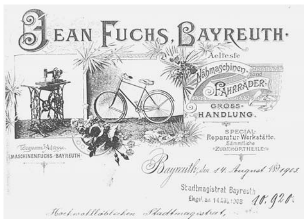
Firemní hlavičkový papír Jeana Fuchse

mětníků došlo v hale, kde Liebisch pracoval, k výbuchu acetylenových bomb, při kterém zhaslo několik životů. Od té doby prý velice úzkostlivě dbal na dodržování bezpečnostních předpisů při svařování, a pokud jich některý ze zaměstnanců nedbal, vždy si měl vyslechnout příběh o výbuchu acetylenu v Kopřivnici.