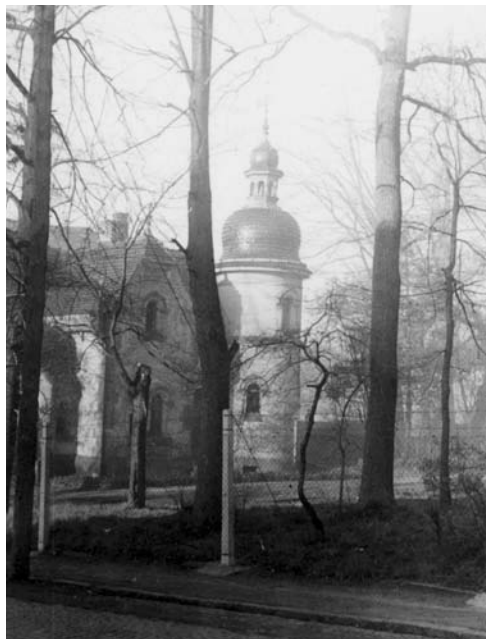
Dnes zbořený dům pro služebnictvo při Hielleho vile