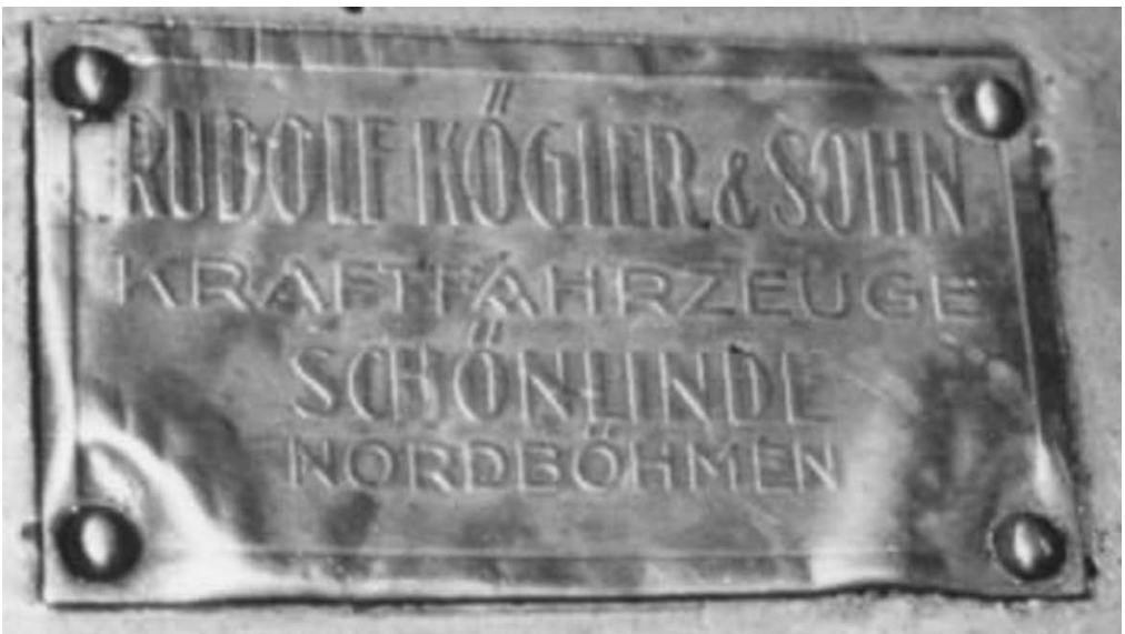
Rudolf Kögler opatřil vůz Bugatti 13 svým firemním štítkem