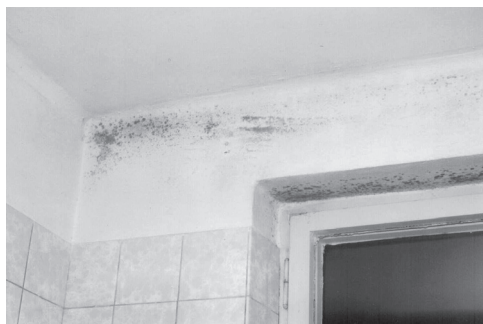
Obr. 1.4 Povrchová kondenzace s výskytem plísní v místě tepelně poddimenzovaného překladu