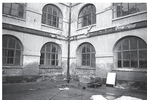
Obr. 1.2 Příklad působení vztlínající zemní vlhkosti

Z tohoto důvodu je nutno rozlišovat kromě vodoodpudivosti povrchové úpravy ještě další vlastnosti omítek, především jejich difúzní odpor a pórovitost. Z tabulky 1.1 je patrná shodná vodoodpudivost tvrdé soklové omítky a porézní sanační omítky. Nesprávné použití