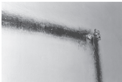
Obr. 1.5 Typickým projevem povrchové kondenzace je orosování povrchů konstrukcí, v tomto případě „obkreslování“ rozvodů studené vody s následným výskytem plísně