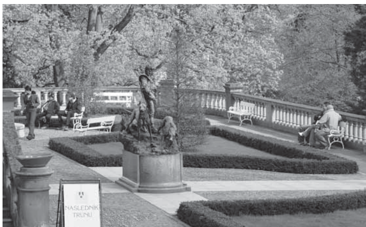
Obr. 1.9 Jižní terasa roku 2006, Konopiště

V letech 1970–74 byla terasa rekonstruována. Důvodem bylo pronikání vody až k izolaci kleneb a průsak vody zdmi. Počítalo se s odvodněním směrem ke schodišti. Nová hydroizolace měla být položena na novou betonovou vrstvu, jež ležela nad cihlami chránícími asfalt, a to v podobě tří asfaltových pásů. Pásky pak měly být chráněny potěrem, či deskami. Spádování bylo provedeno směrem k průčelí/balustrádě. Další fází představovalo vybudování odvodňovacího žlabu pro odvod přebytečné vody po obvodu. Opravy proběhly dle dokumentace jen částečně. Žulové pilíře byly ponechány, ostatní části (z červeného pískovce) rozebrány, rovněž tak značná část balustrády. Na rekonstrukci balustrády byl vypracován samostatný projekt, objednaný ale až v roce 1972. Balustrády tedy byly řešeny až po dokončení hydroizolace, proto se nezrealizovaly odtokové žlabky. Také směr odvodnění byl změněn. Odvod vody totiž nebylo možné dořešit, dokud nebyla dokončena rekonstrukce balustrád. Celá rekonstrukce probíhala celkem drasticky, ze 160 kůželek na balustrádě jich bylo 130 zničeno. Totéž se týkalo madel, trnoží a sloupků. Schodiště bylo rovněž zdevastováno, sanace galerie nebyla zahrnuta. I přes veškeré stavební úpravy se již brzy po rekonstrukci objevily místní průsaky.