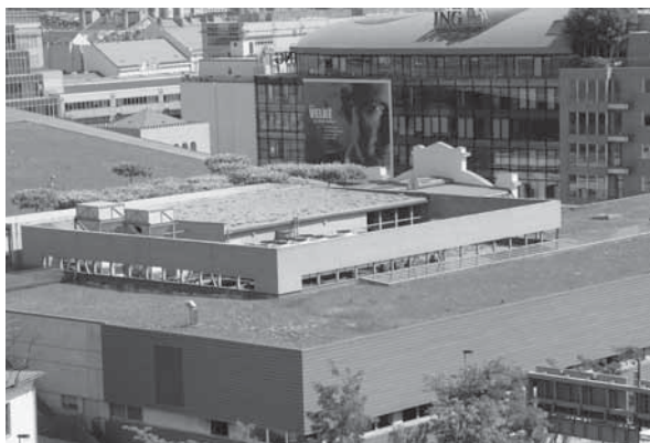
Obr. 1.13 Pohled na KOC Nový Smíchov z parku Sacré Coeur, Praha 5, rok 2006

Na střeše je zrealizována část zeleně jako extenzivní, část jako intenzivní, určitá plocha je zatravněna. Bylo použito 19 odlišných typů skladeb. Na střeše byly vysazeny speciálně (do tzv. střechy) tvarované platany.