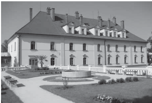
Obr. 1.5 Nejstarší střešní zahrada v ČR – zámek Lipník nad Bečvou, rok 2007

Zámek v Lipníku nad Bečvou vznikl v 16. století. Radikální novoklasická přestavba nastala v 60. letech 19. století pod dohledem stavitele Josefa Ziaka (Žáka). Právě dle jeho projektu se za pomoci zahradníka Ferdinanda Wenzla proměnila terasa na střeše bývalých stájí západního dvorního křídla ve střešní zahradu, která byla pomocí můstku propojena s bývalým salónekem v jihozápadním nároží. Dochovalo se několik Žákových plánů z roku 1863, jež jsou nyní uloženy v archivu lipenského velkostatku v Janovicích. Po 40 letech se vyskytly závady, jež vedly k úplné stavební rekonstrukci terasy. V letech 1910–11 byla terasa upravena do dnešní podoby. Terasu nebylo třeba po celých následujících 80 let opravovat. Pojetí stávajících 600 m 2 neodpovídá původní okrasné koncepci. V letech 2005–2006 proběhla celková rekonstrukce zámku včetně zahrady nad konírnou.