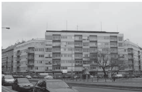
Obr. 1.11 Skleněný palác, Praha 6, rok 2006

Skleněný palác v Praze 6 – Bubenči nazývaný též Domy zemské banky či Skleněný dům je reprezentativní budovou této městské části. Nachází se na náměstí Svobody 1, mezi vyústěním ulic Československé armády a Terronské. Jde o komplex pěti domů, jež mají společný vchod, třístranné průčelí, suterénní parkoviště a plochou ozeleněnou střechu.