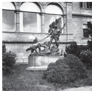
Obr. 1.6 Parkán s přistavěným skleníkem, kolem roku 1749, Konopiště

Původní hrad Konopiště byl založen jako gotická pevnost koncem 13. století Tobiášem z Benešova. Svoji obrannou funkci ztratil kolem roku 1725, což vedlo k řadě změn. Například skleník byl po roce 1734 přestavěn na dnešní oranžerii. Změnilo se i využití jižní terasy (k těmto úpravám bohužel neexistuje dokumentace). Po předchozích barokních přestavbách