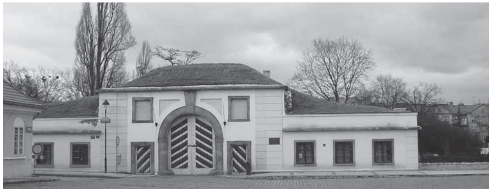
Obr. 1.10 Písecká brána, Praha 6, rok 2007

V letech 2000–2002 proběhla částečná rekonstrukce brány, která je v současné době využívána jako galerie a kavárna.