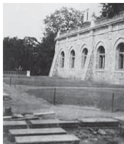
Obr. 1.7 Rekonstrukce terasy roku 1904, Konopiště