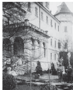
Obr. 1.8 Rekonstrukce terasy roku 1904, Konopiště