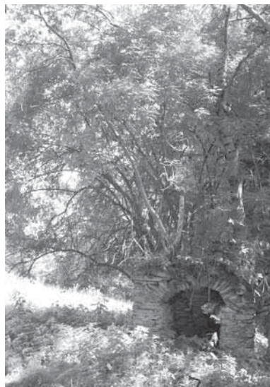
Obr. 1.2 Přirozené osidlování stavby vegetací, Šumava, rok 2006

Konstrukce založené na této technologii nejsou pro vodu zcela nepropustné, a tak zejména v oblastech častějších a vydatnějších srážek bylo třeba pro urychlení odtoku vody ze střešní plochy volit střechy s větším sklonem tak, aby nedocházelo k jejich podmačení. Větší sklon měl za následek, že na 1 m 2 střešní plochy dopadalo menší množství srážek a ty, které dopadly, po střeše rychleji stékaly. Bylo však nutné najít takové kompromisní řešení, aby sklon nebyl příliš strmý, neboť v takovém případě dochází ke zvýšenému působení vodní a větrné eroze na vrchní vrstvy vegetačního souvrství. K boji proti promočení přispíval také použitý materiál – rašelina, která v naprosto suchém stavu nesaje vodu.