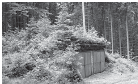
Obr. 1.1 Samovolné ozelenění garáže, Jizerské hory, rok 2007

Vegetace na střešách není z historického hlediska žádnou novinkou. Byla dokázána existence střeš s vegetací již před 3000 lety. První ozeleněné střešy vznikaly z čistě praktických důvodů, tedy nikoli kvůli výslednému estetickému dojmu či ekologickému přínosu, ale jako ochrana před klimatickými podmínkami.