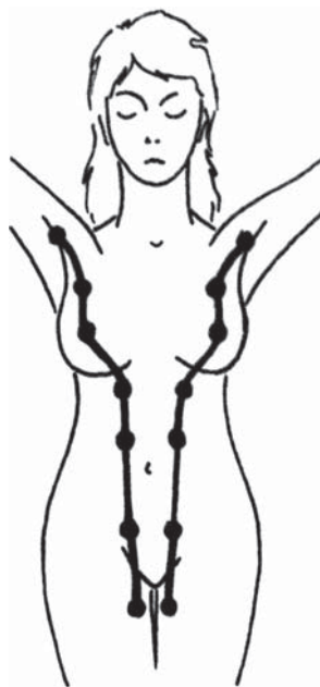
Obr. 1 Mléčná lišta

Další vývoj mammy v dětství a během dospívání probíhá tak, že se nejprve nad úroveň kůže zdvihá areola s bradavkou – infantilní mamma , potom prs nabývá pupencovitého tvaru a je nízký – areolomamma a nakonec se vytváří klenutý, i když nízký prs se zřetelnou bradavkou – mamma papilata . V dalším období se prs dospělé ženy vyskytuje v několika antropologických tvarových typech, které se v průběhu života (těhotenství, involuce žlázy ve stáří) postupně střídají.