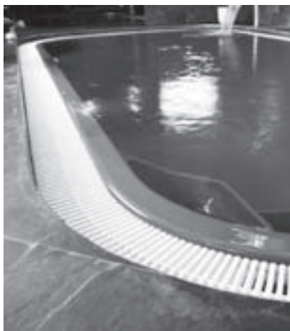
Obr. 9 | Přeliv