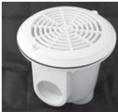
Obr. 3 | Dnová výpust'