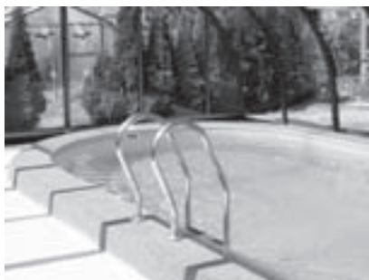
Obr. 11 | Nerezové závěsné schodiště