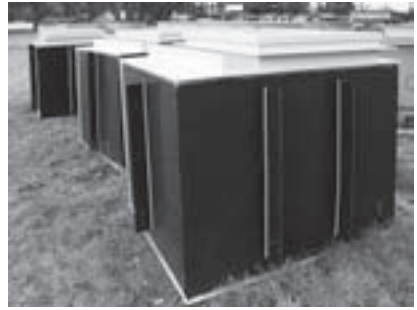
Obr. 6 | Instalační šachta

slanou vodu apod.), motor protiproudu, masážní trysky, kompresory pro vzduchové trysky apod. Instalační šachty se vyzdívají, nebo se dovážejí již prefabrikované. V případě prefabrikace se hojně instalují šachty polypropylenové. Pokud to dispoziční řešení okolí bazénu umožní, je z hlediska vlastníka bazénu vhodnější toto příslušenství umisťovat do lépe přístupných prostor, jako jsou garáže, zahradní domky apod., a to hlavně nacházejí-li se tyto prostory pod úrovní hladiny vody v bazénu. I v případě, že jsou nad úrovní hladiny vody, jsou dodavatelské firmy schopny si s tím poradit.