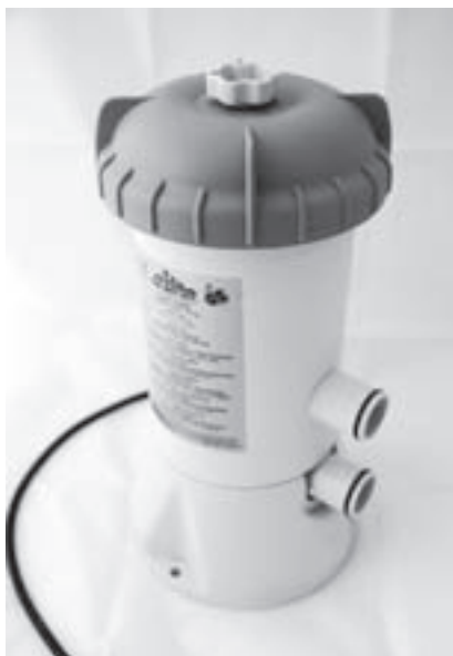
Obr. 4 | Kartušová filtrace