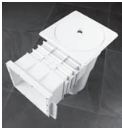
Obr. 10 | Skimmer