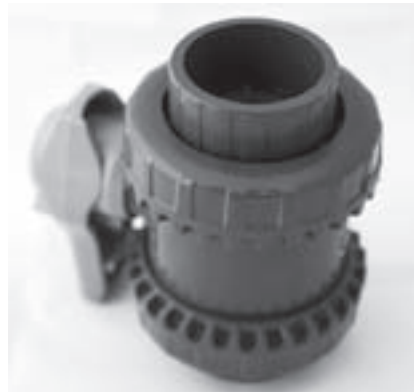
Obr. 7 | Kulový dvoucestný ventil