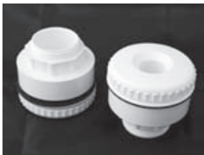
Obr. 12 | Zpětné trysky