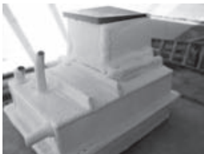
Obr. 1 | Akumulační nádoba