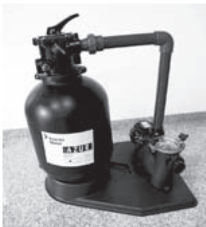
Obr. 5 | Písková filtrace

skimmeru je to v pořadí druhý košík na zachycení mechanických nečistot, a tak pravděpodobnost, že by se do čerpadla dostaly nečistoty, které by ho mohly poškodit, je relativně malá. Voda, která je hnána z čerpadla, proudí přes vrstvu písku, kde dobíhá koagulační (srážecí) proces a současně se zachytávají jemné mechanické nečistoty. Tyto filtrační nádoby se stejně jako filtrační čerpadla dimenzují podle velikosti bazénu, a tedy množství vody, které se má za určitý časový úsek přefiltrovat. Výhodou pískových filtrací je snadnost obsluhy, čištění písku i jeho trvanlivost. Písek se ve filtrační nádobě mění jednou za tři až pět let. Vlastnosti pískových filtrací se dnes dají zlepšit tím, že na místo pískové náplně je použita některá ze speciálních náplní. Oproti písku filtrujícímu částice větší než patnáct mikronů, jsou některé tyto náplně schopny filtrovat částice větší než tři micrometry. Podrobně je kvalita bazénové vody řešena například v publikaci Bazény (1) od docenta Petra Šrytra.