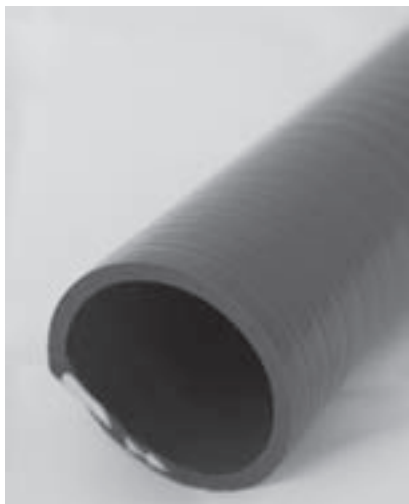
Obr. 8 | Glanaflex