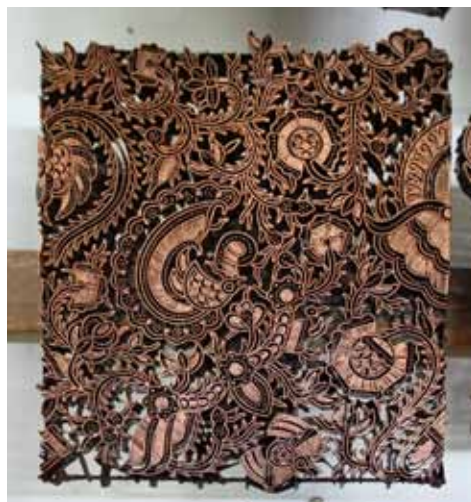
Batikovací razítka jsou sama o sobě uměleckým dílem

V polovině 19. století se v souvislosti se zvyšující poptávkou po batikových látkách a oděvech velmi rychle rozšířila nová technika batikování pomocí měděného razítka, která podstatně zrychlila výrobu a zpřístupnila batik širším vrstvám obyvatelstva. Samotné batikovací razítko je malým uměleckým dílem, které si můžete na Jávě pořídit jako suvenýr na každém větším trhu.