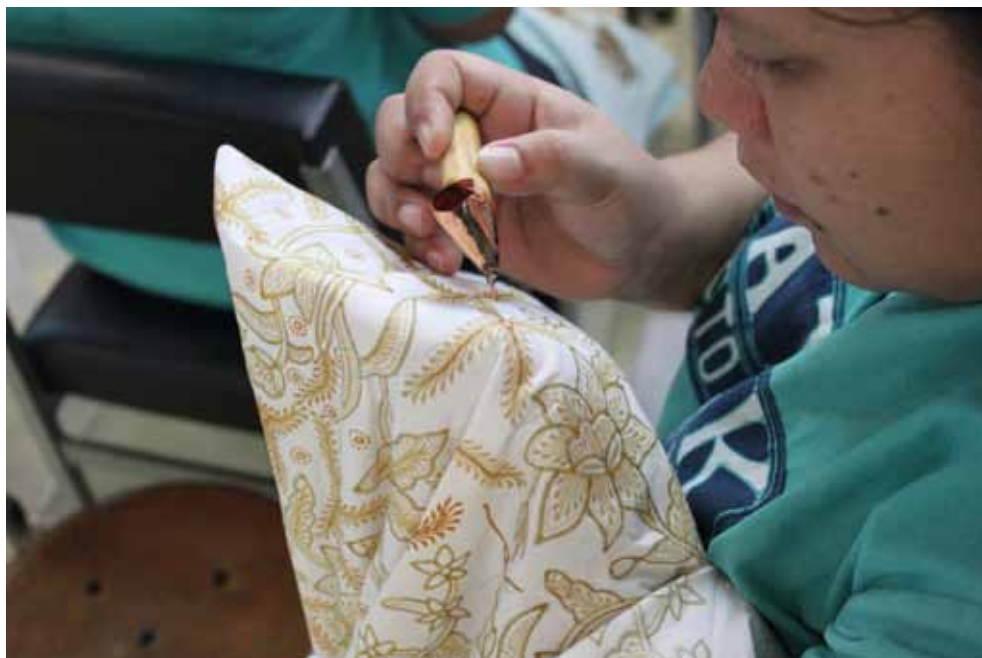
Práce s cantingem

Batikování je velmi náročný a zdoluhavý proces, který vyžaduje velkou zručnost. Samotné slovo batik vzniklo složeninou javánských slov amba = psát a titik = tečka. Nejvíce ceněný je tzv. Batik Tulis ( tulis = psát), ručně malovaný batik , při kterém se vosk na látku nanáší pomocí nástroje canting (čti čanting), měděné nádoby s bambusovou rukojetí. Do této speciální nádoby se nabírá roztavený vosk, který trubičkou vytéká ven. S pomocí tohoto nástroje je možné na podklad doslova psát a vytvářet tak neuvěřitelně jemné vzory.