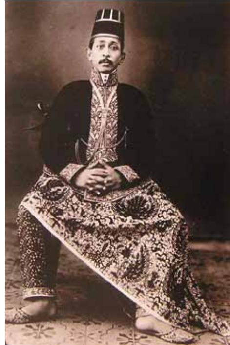
Člen javánské královské rodiny v batikovém oděvu