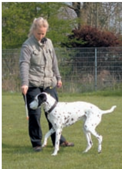
Klik za pohyb směrem k targetu.