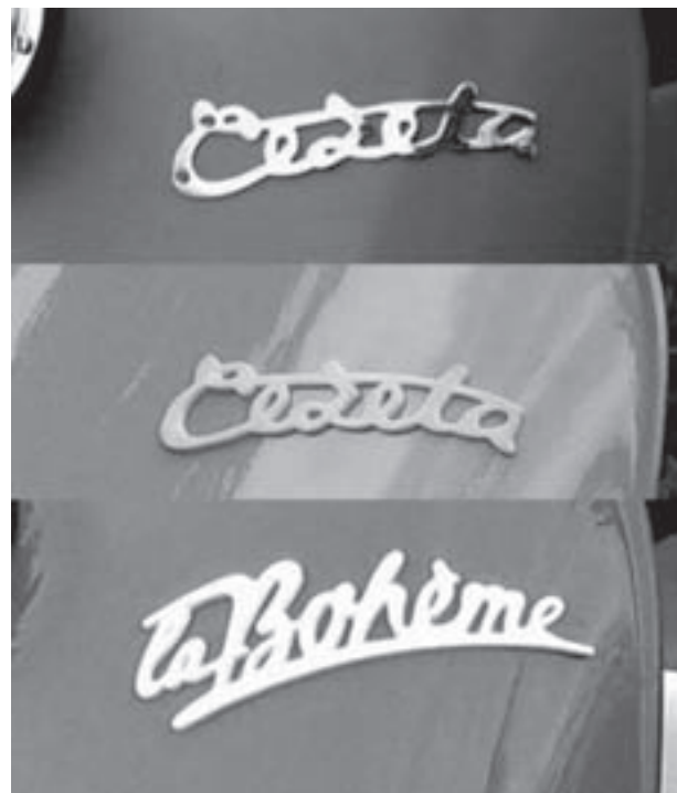
▲ Porovnání názvů skútru Čezeta vyrobených v Českých Budějovicích. Začínalo se chromovaným, později byl plastový. Název „la Bohème“ byl určen pro francouzsky mluvící země

– od provedení 501/01 se liší tříokruhovým střídavým zapalováním, u kterého je jako zdroj použit magnetový alternátor s přerušovačem, kondenzátorem, usměrňovačem 6 V/15 A a tlumivkou místo dynama 6 V/45 W, a odlišnou spínací skříňkou s příslušným el. svazkem