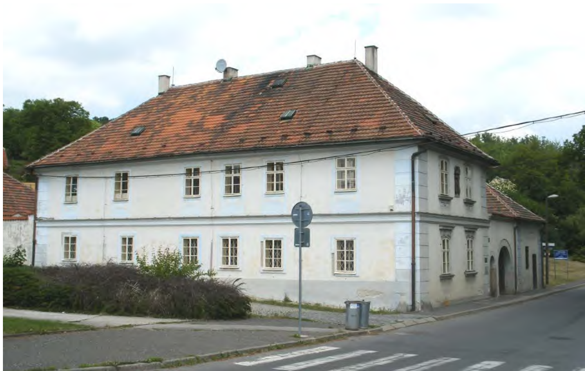
Rodný dům Antonína Dvořáka s pamětní deskou v průčelí vedle brány

V zámku je veřejnosti přístupná rodinná expozice Lobkoviců. Rozsáhlá rodová obrazárna, která tu byla umístěna dříve, byla přestěhována do jejich pražského paláce. Zámek je přístupný od dubna do října, plně vstupné v roce 2012 činilo 95 Kč, snížené 50 Kč.