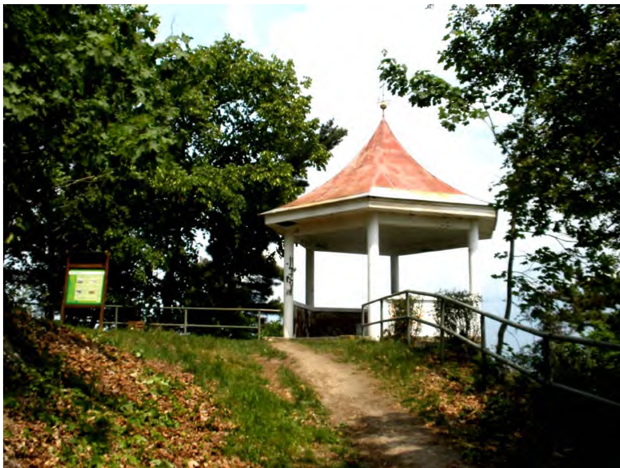
Vyhlídkový altán na Hostibejku

Lutovnik je les, kolem něhož jsme prošli. I on má staroslovanské pojmenování, které vyjadřuje lítost a smutek, neboť naši předkové měli v těchto místech své pohřebiště. Zvláštní pohled se nám naskytne na místo přímo před námi. V polích tu stojí nezvyklé a rozlehlé sídliště naprosto stejných řadových rodinných domků v dominující hnědé barvě. Těch domků je tu na místě, kterému se podle investorské společnosti říká „Anglický resort“, celkem 114 a tvoří součást nedaleké vsi Lešany.