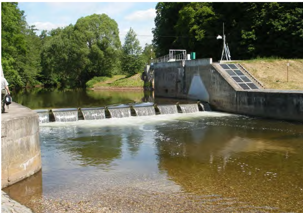
Moderní jez na Úpě u Vilémova mostu