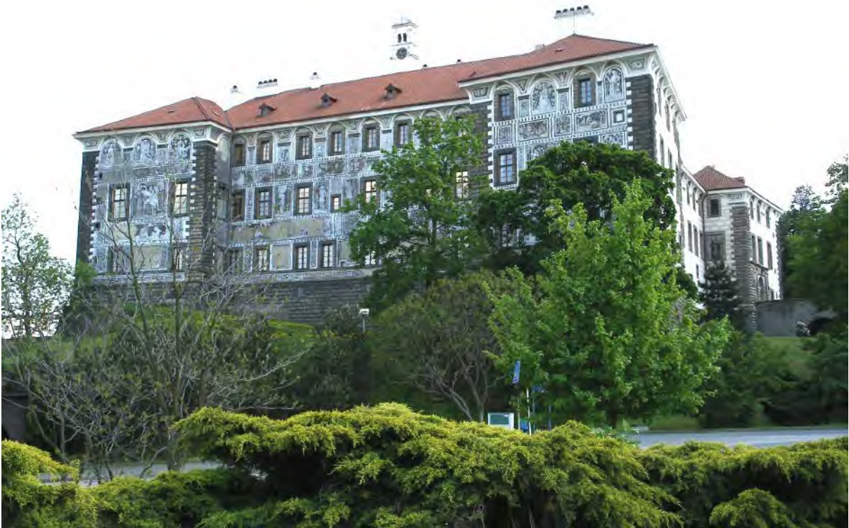
Severní křídlo nelahozeveského zámku a jeho nádvoří