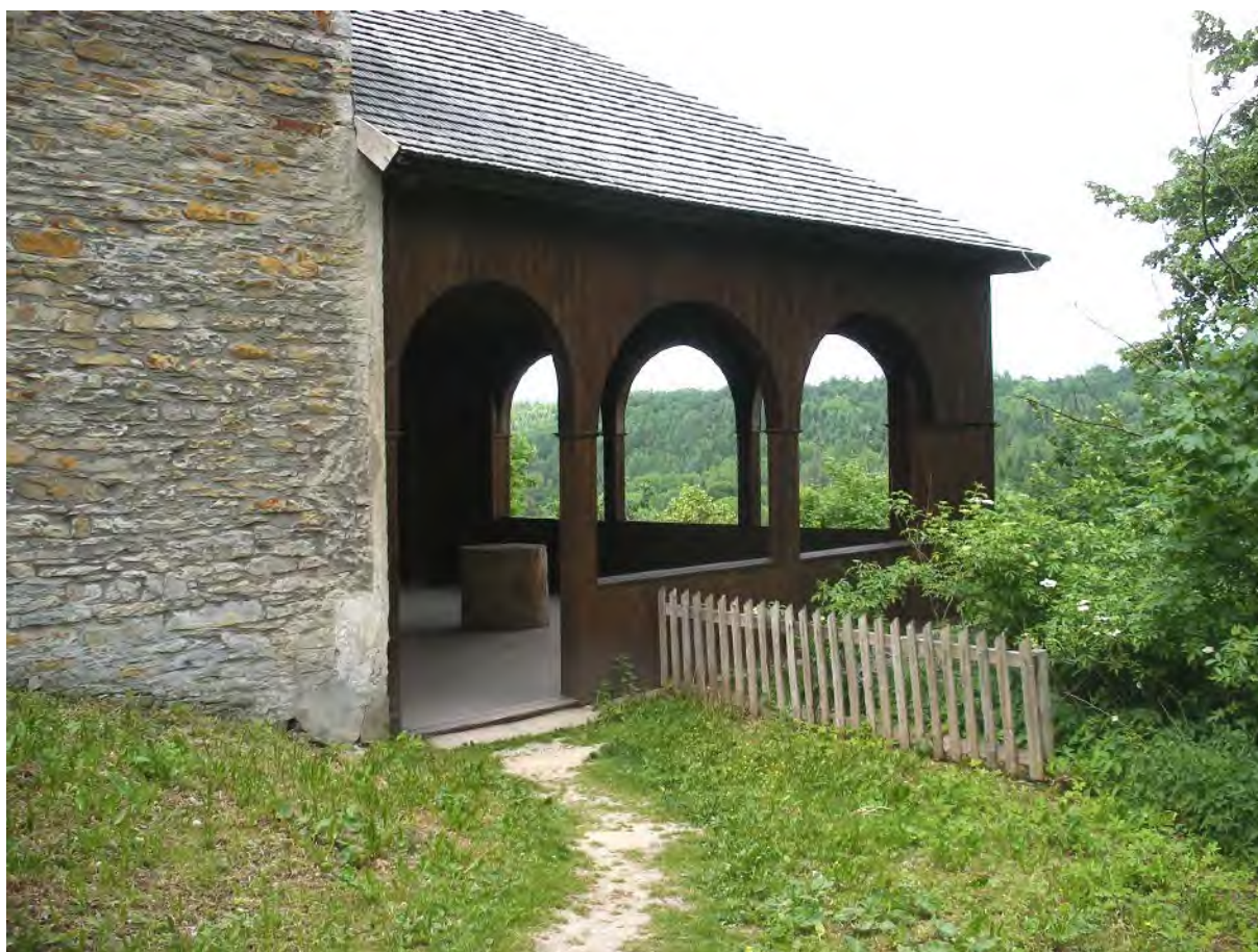
Rýzmburský altán s pověstným jedlovým špalkem