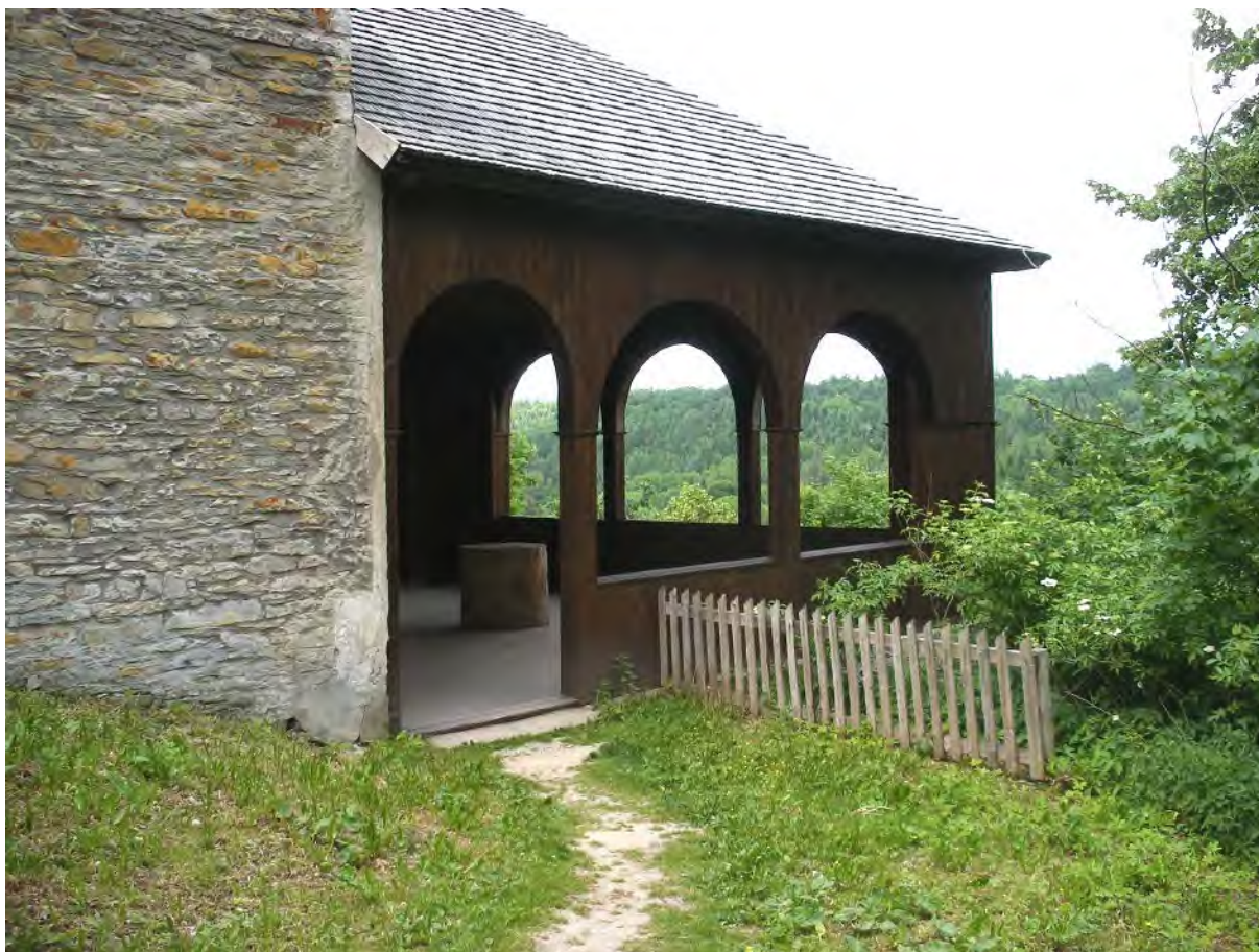
Rýzmburský altán s pověstným jedlovým špalkem

Jednou Ctibor doprovázel svého pána na turnaj do Prahy, kde v souboji porazil jakéhosi německého rytíře. Tehdy bylo zvykem, že poražený musel vítězi zaplatit příslušnou odměnu. Němec však místo placení naskočil do kočáru a začal ujíždět. Ctibor se za ním rozběhl a popadl kočár za kolo takovou silou, že mu část jeho loukotě zůstala v ruce. Kočár se převrhl, Němec se musel zahanbeně vrátit a zaplatit dluh, zatímco Ctibor byl za svůj husarský kousek povýšen do rytířského stavu. Pověst pochází patrně ze 16. století, kdy Rýzmburk patřil Žehušickým z Nestajova, kteří měli ve znaku právě loukoť, a pověst měla zřejmě vysvětlit jeho původ.