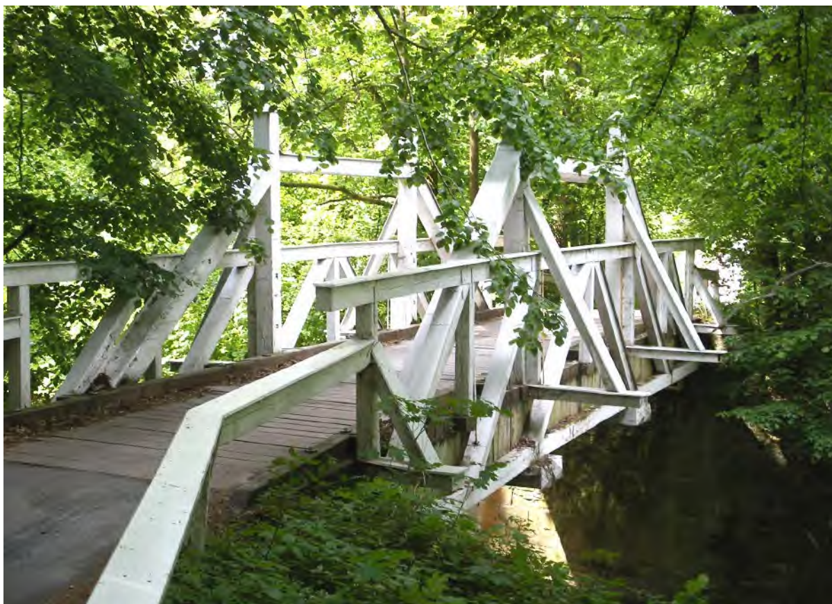
Pod Rýzmburkem odedávna překračovaly Úpu dva dřevěné mosty rozlišované barvou, Červený a Bílý, a jsou tak udržovány dodnes Viktorčin splav býval původně dřevěný, návštěvníky však přitahuje i současný betonový