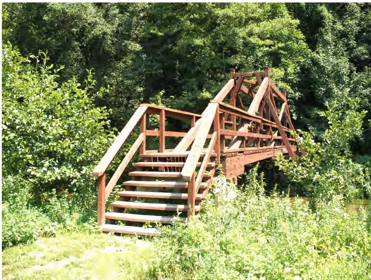
Žernovská lávka přes Úpu

Značka od lesa zamíří přímo k silnici a dá se po ní vlevo. Čeká nás sice nedlouhý, ale nepříjemný úsek, protože silnice bývá dosti frekventovaná. Na dominantním návrší se rýsují domky Žernova a my si patrně teprve teď uvědomíme krásnou polohu této obce. Podíváme-li se k jihu nebo východu, otevře se nám nádherný pohled na rovinu kolem Rozkoše i na vrcholky Orlických hor i dalších kopců na pomezí Kladska.