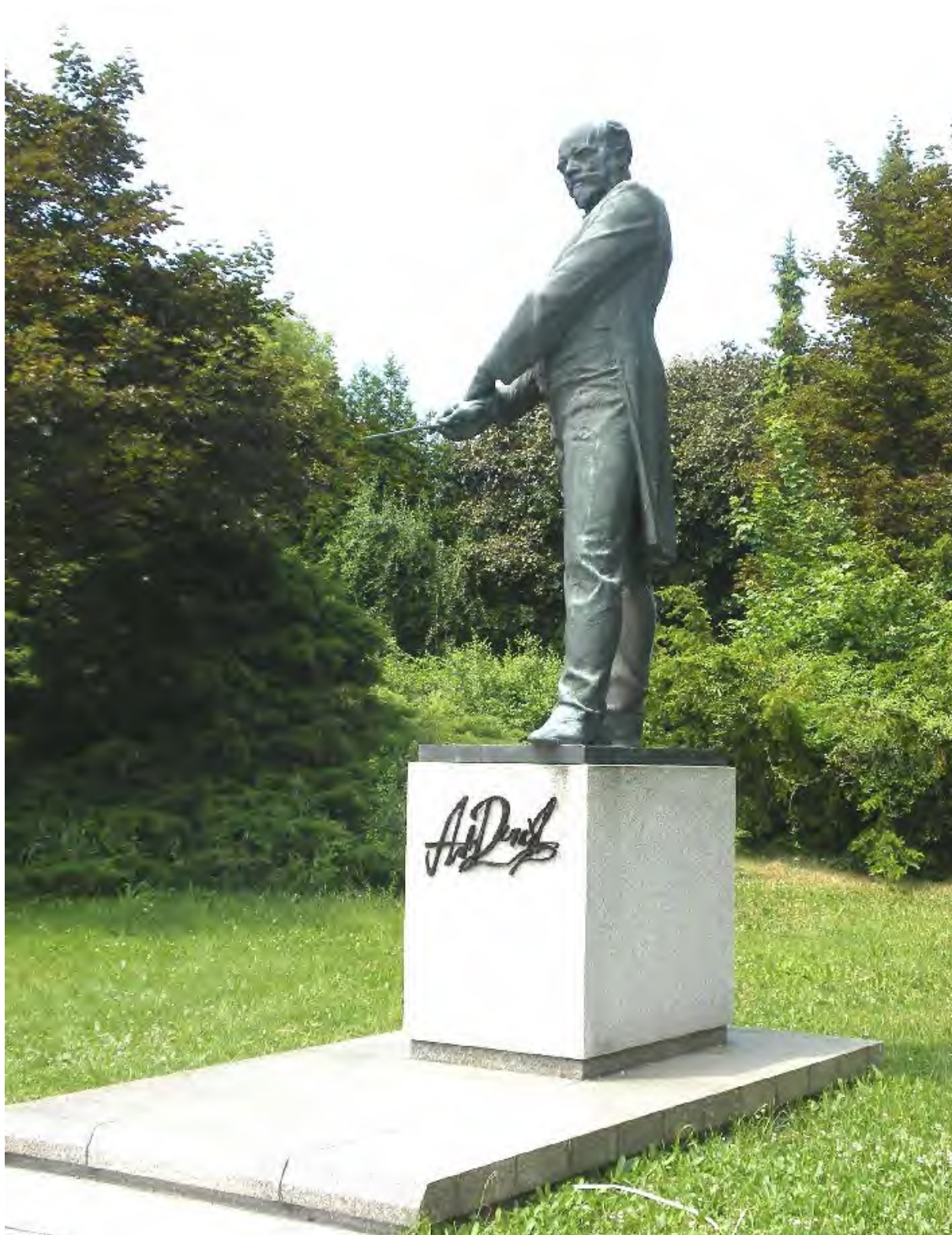
Dvořákův pomník stojí v Nelahozevsi od roku 1988