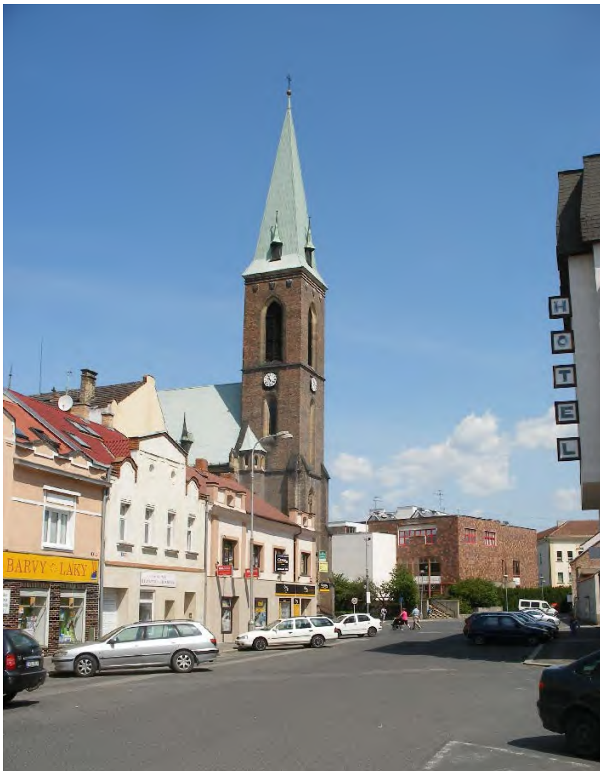
Novogotický kostel v Kralupech nad Vltavou byl postaven v letech 1894-1895