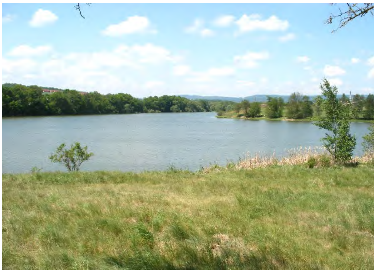
Pohled na rybník Strž

Na silničku po břehu rybníka je zakázán vjezd, vyjdeme tedy po červené a zelené značce, které právě tady začínají. Zanedlouho se přiblížíme k hrázi, u jejíhož začátku je přepad, kterým z rybníka vytéká potok. Vlevo nad výpustí se tyčí skalnaté návrší, na němž vidíme štíhlý hranolový kamenný sloup. Je od něj hezký pohled na rybník a zakrátko se k němu ve vyprávění vrátíme. Stačí ještě několik kroků po cestě a stojíme před brankou. Za zdí se tu pod hrází ukrývá prostý patrový domek, v němž je nyní expozice Památníku Karla Čapka.