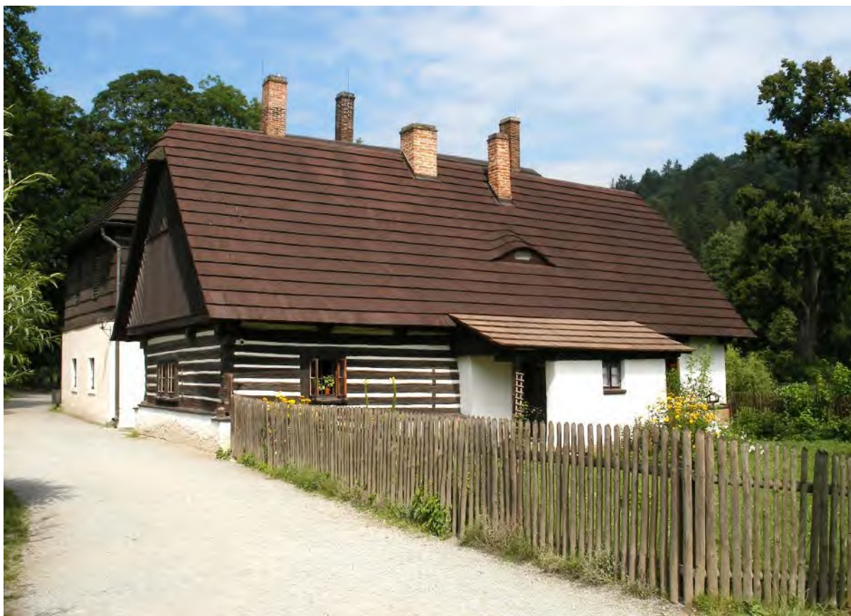
Staré bělidlo a slavný pomník Babičky s vnoučaty