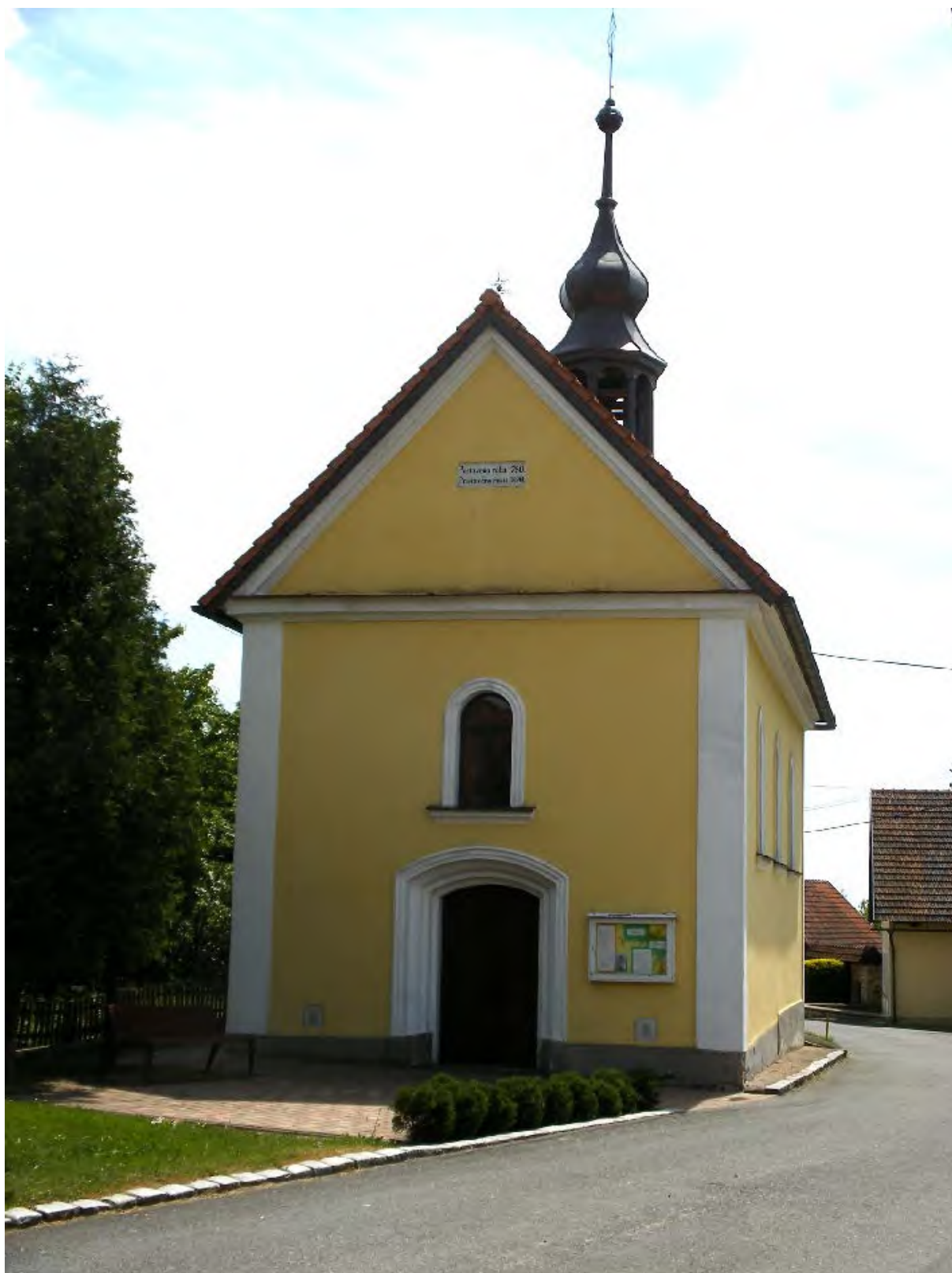
Kaple Panny Marie Sněžné v Žernově