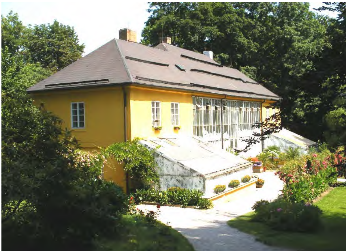
Skleník v zámeckém parku na místě původního Starého bělidla Pohled na ratibořický zámek od řeky