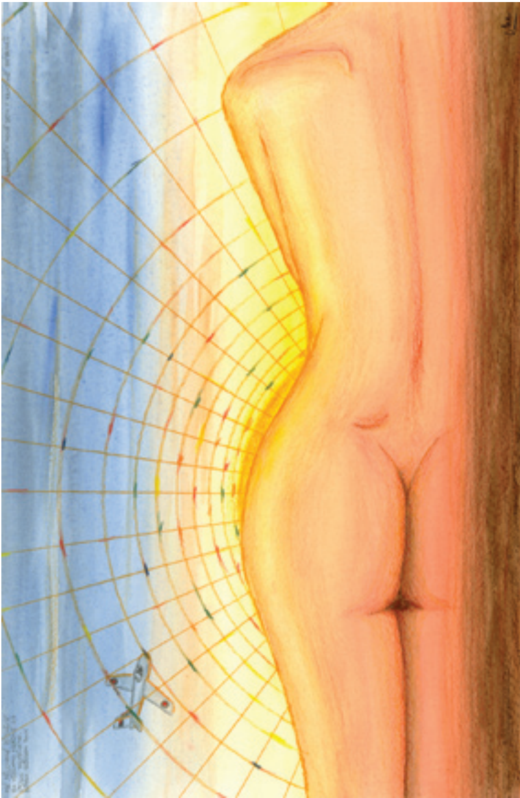
Východ slunce nad pohorím zázraků (akvarel a pastel)