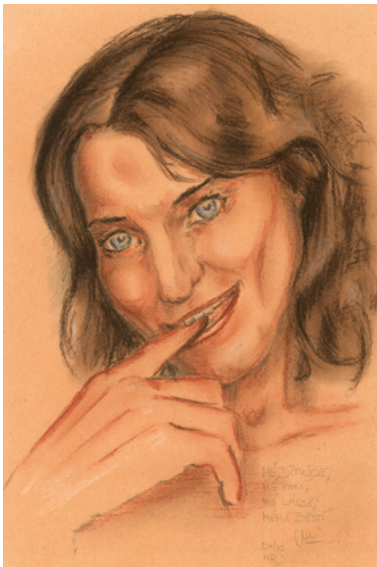
Má milovaná Dituška (pastel)