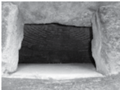
Obr. 2 Princip shodný s dnešní technologií