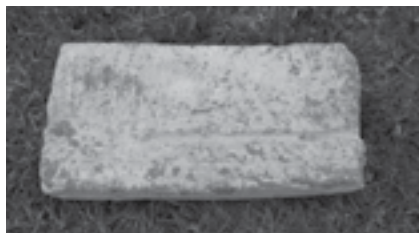
Obr. 5 Tvrdě pálená cihla z dřevěné formy

Pálení při nižší teplotě, tedy kolem 890 °C, zajišťuje rychlou teplotní prostupnost materiálu a dlouhodobé akumulční schopnosti při teplotách od 170 do 250 °C (pečení chleba). Měkce pálené cihly však nejsou vhodné pro venkovní zdivo.