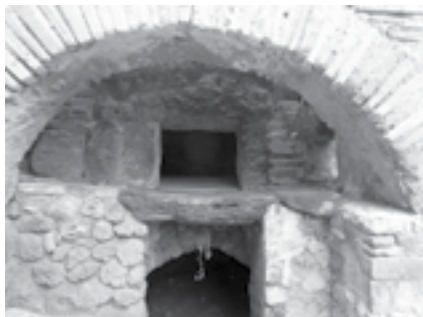
Obr. 1 Pompeje, dva tisíce let stará pec na chleba

Kruhové pece byly využívány zejména na černém kontinentě, kde měly i ostatní stavby běžně kruhový půdorys. Využití těchto pecí bylo různorodé, ale zásadně byly venkovní. Obchodními cestami se informace o způsobu stavby kruhových pecí rozšířily přes Gibraltar do dnešního Španělska a také do Itálie, která světu dala ochutnat svoje národní jídlo – pizzu. S nárůstem potřeby pece zastřešit se začaly prodlužovat, čímž dospěly k válcovému tvaru . Postupně se, zatím ještě bez komínu, začaly přesouvat dovnitř obydlí. Vlastní střechu tak již nepotřebovaly, a prostor nad klenbou se proto začal využívat jako plocha na ležení.