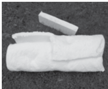
Obr. 3 Ukázka pevné desky a rohože Sibrál

Nejlепším izolantem je vzduch, účelem všech izolací je proto udržet jej v co nejmenších uzavřených, jednotlivě oddělených komůrkách. Lze tedy říct, že izolace musí být v první řadě prodyšná. Dříve se používalo rozemleté sklo, dnes je nejčastěji používanou izolací do pecí Sibrál. Je to v podstatě porcelán rozemletý a roztažený do dutých vláken; jeho teplota tání je daleko za možnostmi přírodního ohně.