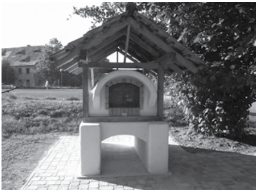
Obr. 7 Venkovní pec ruského typu

Ke stavbě potřebujeme nejenom mít vhodný materiál a odpovídající nářadí, ale také zvolit správné místo. Protože pec nemá komín, využíváme povětrnostních vlivů. Poloha pece v dolíku neboli v údolí není nevhodnější, stejně jako na vrcholu kopce. Dobré místo je buď v závětrí, anebo pod vrcholem kopce tak, aby v průřezu byl vždy kopec vyšší, než je samotná pec. Důležitou roli hrají také světové strany. Dvířka pece musejí směřovat vždy na