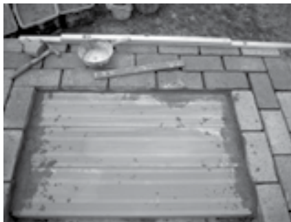
Obr. 9 Hurdisky

Další vrstvu nad klenbou tvoří hurdisky. Jejich dutý prostor napomáhá k tomu, aby teplo ze dna vytopené pece neunikalo do vyzděného základu, což je pro pečení velmi nežádoucí. Zdíme je naplocho na maltu souběžně s přední krátkou stranou a vystředíme na zděný základ. Je to zhruba velikost ložného prostoru vnitřku pece. Zbývající tři obvodové řady cihel k nim dorovnáme do stejné výšky. Hurdisky na koncích lehce zalijeme hustší maltou tak, abychom nezaplnili jejich duté prostory. Musí však být zality dokonale, aby vrchní vrstva křemičitého písku nepropadávala mezi maltou a hurdiskou do vnitřního prostoru hurdisky. Další tři řady cihel jsou vyzděny po obvodu kolem dokola na šířku 15 cm; celková výzdívka je zhruba jeden metr vysoká.