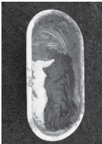
Obr. 4 Rozmíchaná kamnářská hlína

Hlavním úkolem další složky kamnářské hlíny – bakterií – je zabránit zplesnivění a následnému rozpadu hlíny. Získáme je z kravského lejna, které jako jediné z organických trusů neplesniví. Bakterie se v hlíně rychle množí při teplotách nad 18 °C. Při každém dalším novém míchání si necháme část staré hlíny o velikosti golfového míčku. Ten potom přimícháme k přibližně 100 kilogramům nové hlíny. Do dvou hodin jsou už bakterie rozmnoženy v celé hmotě.