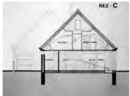
Obr. 6 Řez přístavbovou sekcí se shrnovacíím zasklením zimní zahrady na léto