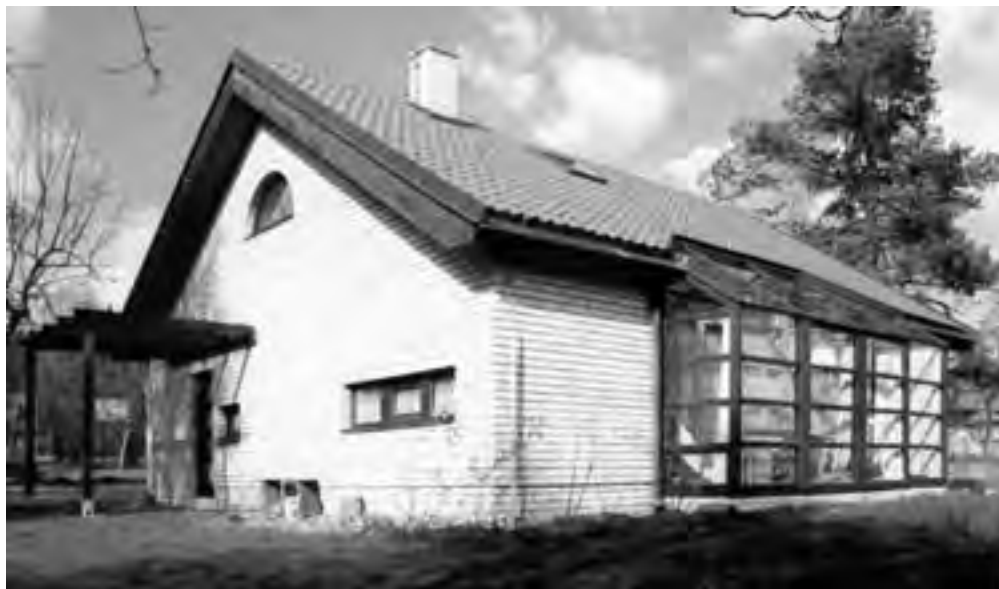
Obr. 10 RD u Mníšku pod Brdy s první reálnou zkušeností s šikmou nestíněnou prosklenou plochou zimní zahrady, zateplený izolací Climatizer Plus v tloušťce 120 mm

ticky šetrný (tzn. lépe izolovaný) RD si podle mého konceptu postavil kamarád pro své rodiče na důchod, a to až těsně po revoluci (obr. 10). Ale ani takoveto energeticky minimalistické domy ještě dlouho nikoho nezajímaly. Já jsem do doby, než jsem pracoval pro klienty z prvního nízkoenergetického domu, mohl jen šířit osvětu, aby jich mohlo přibývat. Dále jsem spolupracoval s Bohuslavem Blažkem, třeba i na územním plánu sídelního útvaru Libčevěves. Během toho jsem se stal i lektorem první ze Škol obnovy venkova , která tu vznikla jako klíčová rozvojová aktivita obce. I zde jsem mohl začít s předáváním informací o možnostech energetických úspor v provozu i ve výstavbě budov.