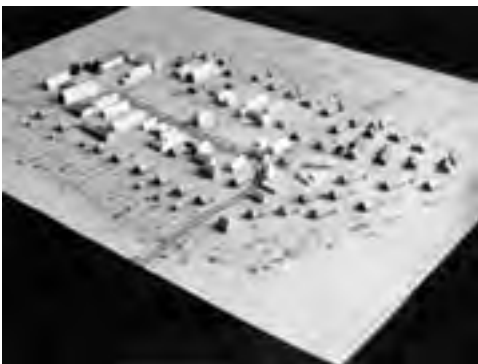
Obr. 3 Model urbanismu doplňování původní vesnice postupným dorůstáním a zahušťováním v duchu původní vesnice založené v období gotiky