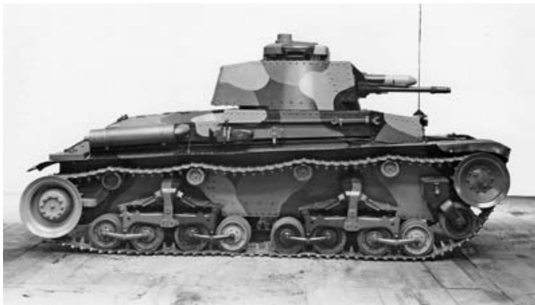
Standardní tank předválečné československé armády LT vz. 35 (Škoda Š-II-a)

V květnu 1945 po osvobození Československa, po šesti letech nacistické okupace, rozbití státní struktury a devastace v důsledku druhé světové války, nastal čas opět vybudovat ozbrojené síly. Předválečná československá armáda, stejně jako armády v okolních nově vznikajících státech, se mohla opřít o zkušenosti svých vojáků v bojích první světové války s používáním obrněných vozidel. Proto s nimi počítala ve své sestavě od samého počátku, navíc díky vyspělému průmyslovému zázemí i s tím, že je bude získávat z domácích zdrojů.