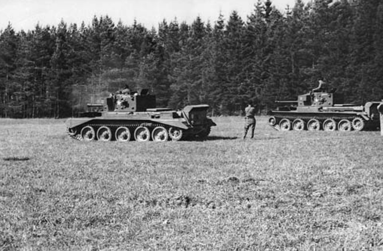
Tanky Cromwell IV při výcviku ve střelbě z kulometu na polní střelnici

ještě 14. brigádu. 1. tankový sbor jako největší úderná síla měl sloužit jako dispoziční jednotka hlavního velitelství operující armády.