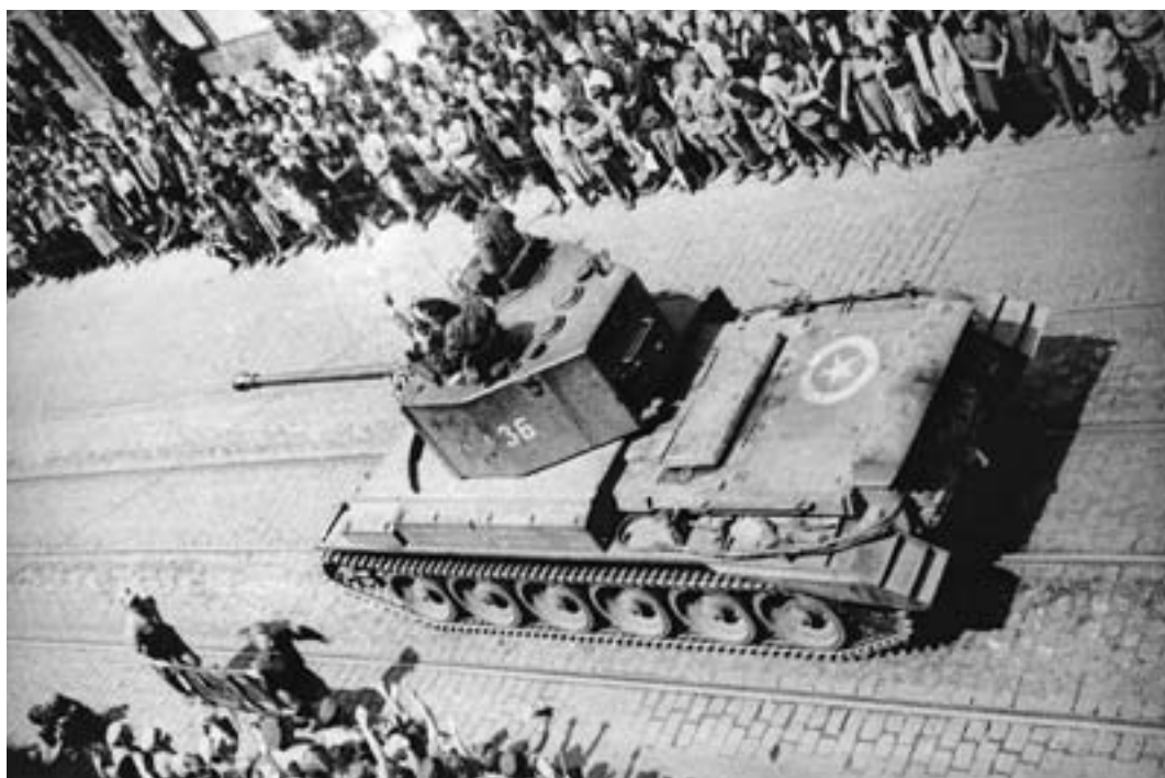
Tank Challenger ze stavu Československé samostatné obrněné brigády při květnové přehlídce v Praze

Počátky této vlastně jediné bojové pozemní československé jednotky na západní frontě je možno najít již po evakuaci zbytků pěší divize, která se vytvořila z Čechů a Slováků ve Francii,