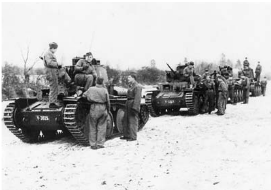
Slovenští tankisté při výcviku se svými nejrozšířenějšími tanky LT-38

Do roku 1944 v Plzni běžela linka na výrobu šasi s kolopásovými podvozky obrněných transportérů HKL 6p. A konečně od srpna 1944 začaly z Plzně vyjíždět opět kompletní obrněná vozidla, tentokrát tankové stíhače Hetzer, vyráběné v licenci pražského konkurenta. Byly jich zde objednaný tisíce, ale do konce války se podařilo vyexpedovat pouze 766 kusů. Oba závody tak v důsledku válečné výroby značně zvýšily svoji kapacitu a modernizovaly technologické postupy, avšak Spojenci je v samém závěru války silně rozbombardovali. Poválečné Československo proto mělo svoji tradiční tankovou výrobní základnu ve značně poničeném stavu, nicméně dokázalo ji brzy uvést znovu do provozu a využít pro opravy a nové dodávky obrněných vozidel.