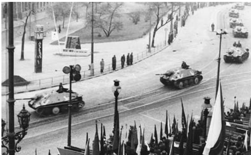
Stihače ST-I na přehlídce v roce 1948