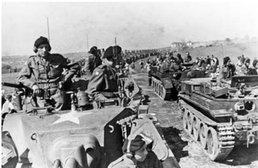
Hlavní zdroj obrněných vozidel v roce 1945 – kolony tanků Československé samostatné obrněné brigády