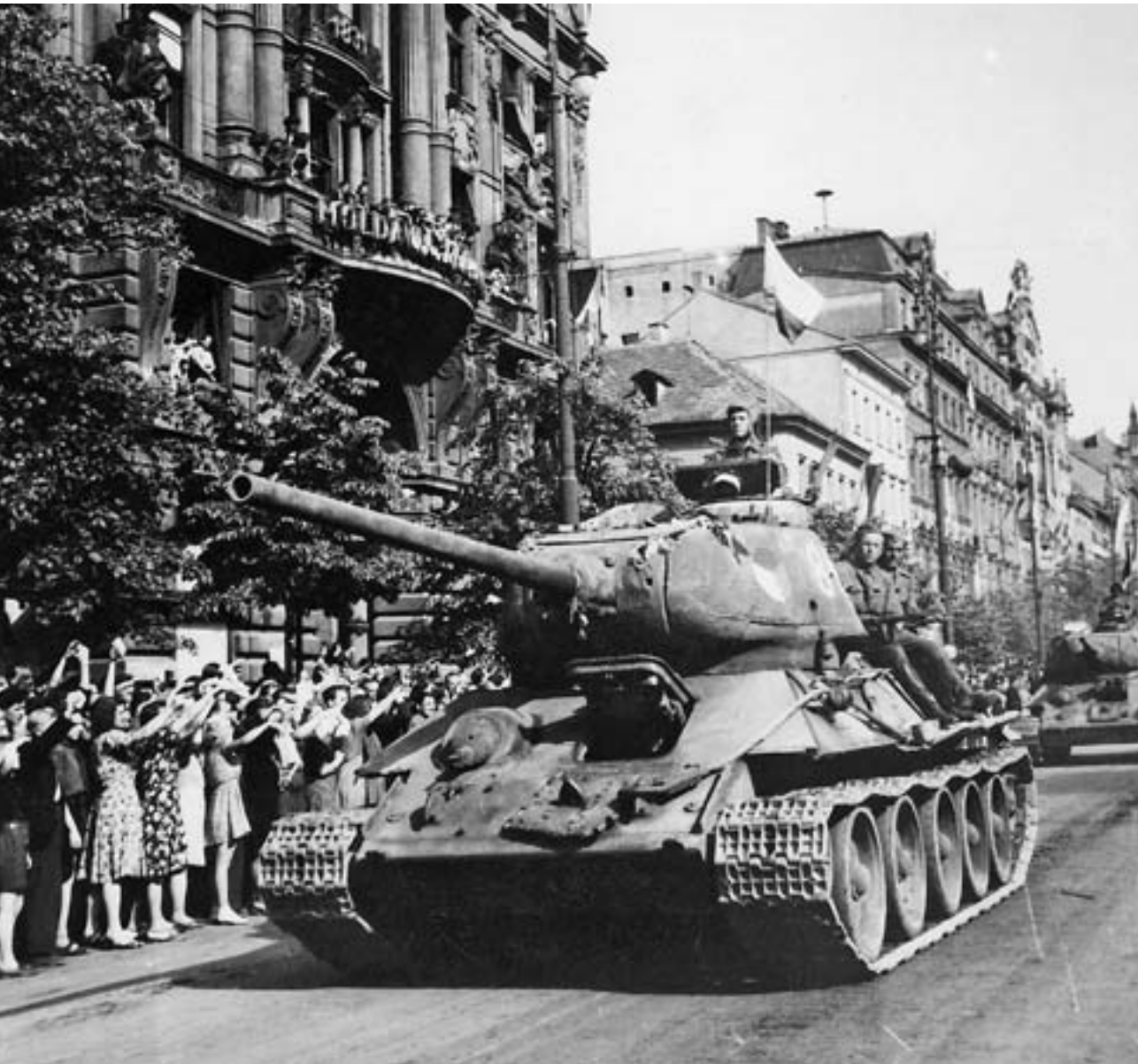
T-34/85 při přehlídce 1. československé samostatné tankové brigády v květnu 1945

Po stažení z fronty se konečně dočkala nových tanků a dostatečně personálně obsazena téměř 1500 vojáky a vyzbrojena 69 tanky zahájila 10. března 1945 z polského území útok na Ostravu. Tuhé boje trvaly až do 5. května a 1. čtb v nich ztratila mnoho svých příslušníků a přišla také o valnou většinu svého pancéřového materiálu, neboť nebyla doplňována. Prakticky bez oddechu její zbylé tanky vyrazily 7. května na pomoc povstalcům v Praze a tři z nich skončily svoji bojovou cestu 10. května 1945 ráno symbolicky před Pražským hradem. Ze stavu brigády zbylo po válce pouze 15 tanků: jeden lehký T-70M a 14 středních – čtyři T-34/76 a deset