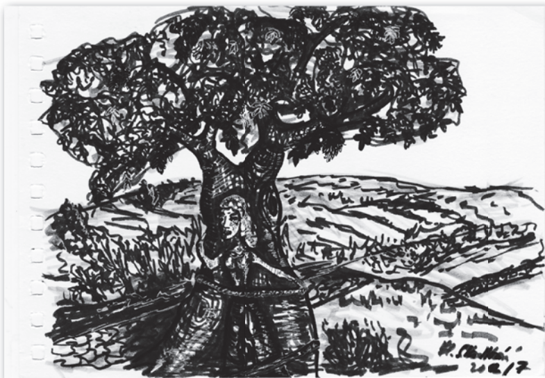
Annu pak přivázala v lese ke stromu.

„Tak dlouho jsem na vás čekala!“ nedala princovi čas na pochybnosti.