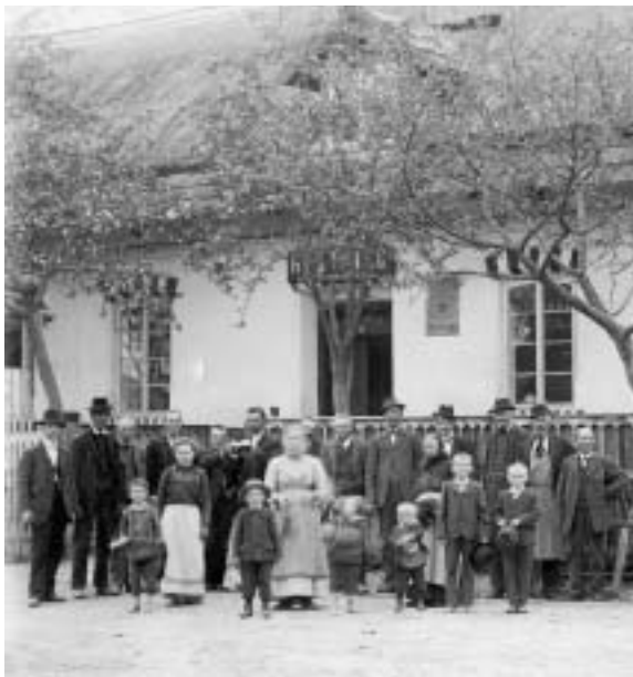
Hostinec v Branžeži, okolo 1900