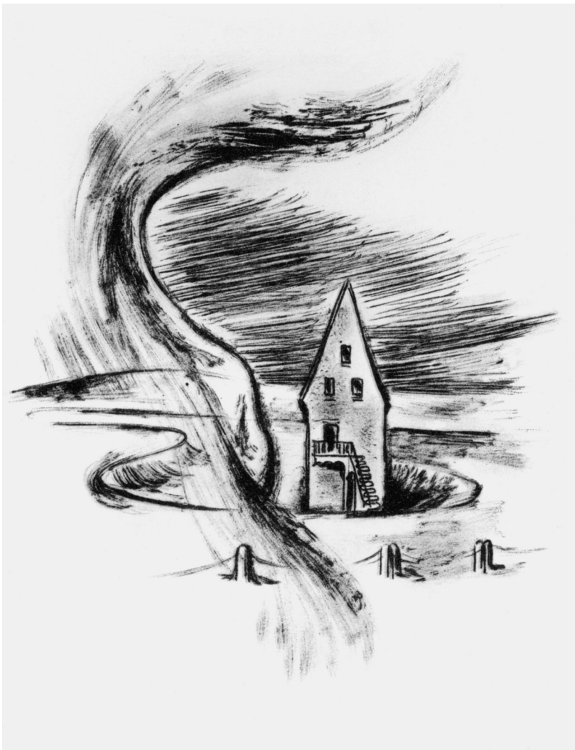
„Noc nad zemí/zvanou Čechy!“ (Ilustrace Miroslava Truksy v básnické sbírce Kamila Bednáře Vánoce v Čechách , Praha, Václav Petr, o Novém roce 1941)