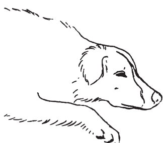
Řeč těla: Uvolnění

Na druhou stranu přivřené oči, skloněná hlava, uši do stran a těžké vzdechy jsou jasnými signály relaxace a potěšení. Neustále sledujte řeč psího těla a svou práci jí přizpůsobujte.