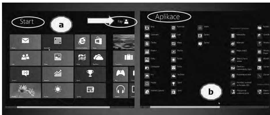
Obrázek 1.1: Rozhraní Úvodní obrazovka / Start; základní vzhled a vzhled Aplikace

Základní vzhled rozhraní Úvodní obrazovka / Start vidíte na obrázku 1.1 (označeno písmenem a). Pokud ovšem klepnete pravým tlačítkem myši na plochu, rozbalí se spodní panel, který v pravém spodním rohu obsahuje tlačítko Všechny aplikace (All apps) . Klepnutím na toto tlačítko se potom vzhled obrazovky změní (viz obrázek 1.1, písmeno b) a dlaždice znázorňující programy jsou podstatně menší.