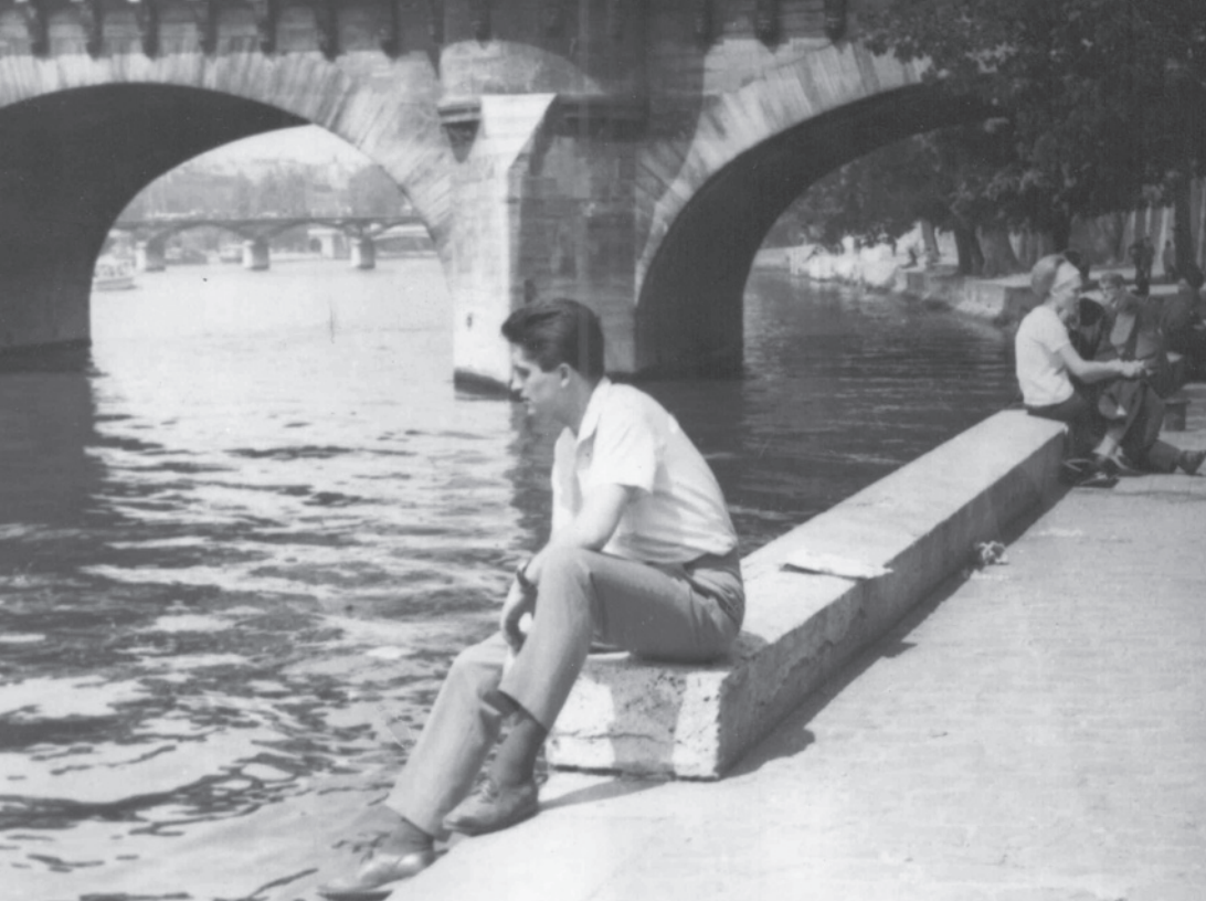
Jiří Dienstbier na břehu Seiny, 1963

jak nečekaně složité je období, do kterého vstoupil svět po dvoubarevných, černobílých letech studené války.