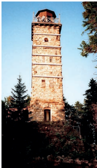
Rozhledna na Tisovském vrchu

Pokud máme dostatek času, můžeme si zajet na nedaleký královský hrad Loket ze 13. století. Tady je k vidění expozice věnovaná historii hradu, dále výstava porcelánu a několik dalších hradních objektů včetně věže, odkud je pěkný výhled do okolí.