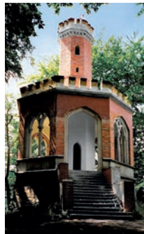
Vyhlička Karla IV.