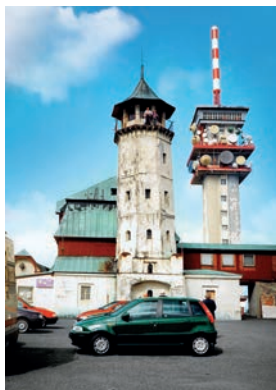
Původní rozhledna na Klínovci

Nedaleko odtud se rozkládají Božídarská rašeliniště, jimiž prochází asi tři kilometry dlouhá naučná stezka. S rozlohou 930 hektarů to jsou největší rašeliniště v Krušných horách. Kousek za hraničním přechodem do Německa se pak vypíná už zmíněná druhá nejvyšší hora Krušných hor, 1215 metrů vysoký Fichtelberg s rozhlednou, horskou chatou, meteorologickou stanicí a lanovkou.