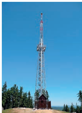
Rozhledna na kopci Krudum

Pověstmi opředený, hlubokými lesy porostlý kopec Krudum se vypíná ve Slavkovském lese mezi Sokolovem a Horním Slavkovem. Jeho původní správný starobylý název Krudum byl později nahrazen počestlým názvem Chrudim. V současné době se však opět začíná užívat dřívější správný název. Na mapách je označen jeho vrchol nadmořskou výškou 838 metrů, protože se zde nachází trigonometrický bod.