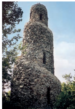
Rozhledna na Krásenském vrchu

Kousek odtud se nachází zámek v Bečově nad Teplou, kde je možno si prohlédnout relikviář svatého Maura (národní kulturní památka) a zámecké interiéry.