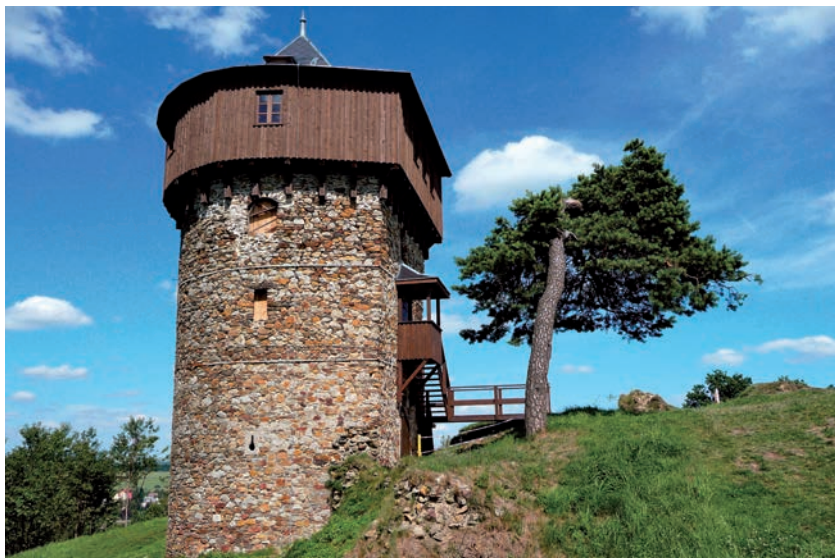
Vyhlídková věž na hradě Hartenštejn

Podle pověsti prý kdysi místní pasáček pásal u Hartenštejna ovce. Tehdy se mu zjevila Bílá paní – zakletá princezna z hradu. Řekla mu, že vždy po sto letech ji může někdo vysvobodit, když přečká tři noci na hradě. Potom se princezna stane i jeho ženou. Pasáček se o to tedy pokusil. Dvakrát se mu zakletá princezna po půl noci zjevila v nějaké hrůzné podobě a on vždy odolal a přízrak zahnal. Po třetí však strachy utekl a princezna tak zůstala nadále zakletá. Od té doby každých sto let čeká na své vysvobození. Zatím však zřejmě marně.