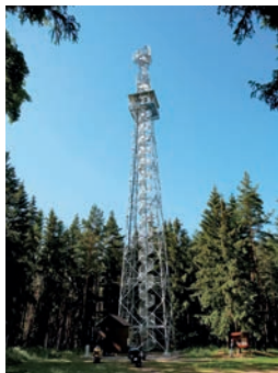
Rozhledna na Panském vrchu

Nevýrazný zalesněný Panský vrch se zvedá nad obcí Drmoul zhruba pět kilometrů na jihozápad od Mariánských Lázní. Na turistických mapách vydaných Klubem českých turistů je uvedena nadmořská výška Panského vrchu 648,8 metru. To je však výška trigonometrického bodu, kde zřejmě dříve stávala dřevěná triangulační věž. Současná železná telekomunikační věž (rozhledna) však byla postavena asi půl kilometru na jih od trigonometrického bodu, na jižním výběžku Panského vrchu, v nadmořské výšce 657 metrů. Tato nadmořská výška však není na turistických mapách uvedena.