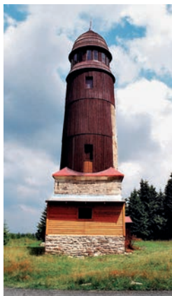
Rozhledna na Blatenském vrchu

Pojedeme-li z městečka Boží Dar v Krušných horách krásnou lesnatou krajinou kolem Božídarských rašelinišť směrem na západ, narazíme asi po 10 kilometrech na odbočku vpravo, vedoucí na Blatenský vrch , který dosahuje nadmořské výšky 1043 metrů. Úzká, necelý kilometr dlouhá asfaltová silnička nás zavede až k rozhledně, kde můžeme zaparkovat. Nejbližší železniční stanice v Horní Blatné je od rozhledny vzdálena přibližně dva kilometry.