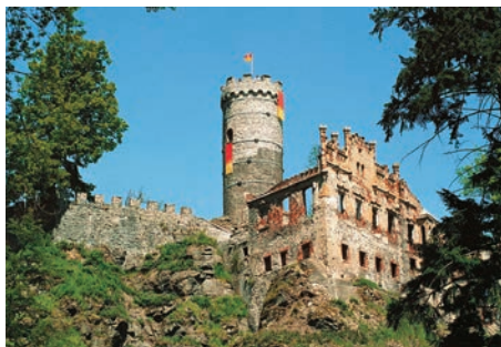
Horní hrad (Hauenštejn)

Tento gotický strážní hrad byl založen ve druhé polovině 13. století Přemyslem Otakarem II. k ochraně obchodní cesty procházející údolím řeky Ohře. Později byl také majet-