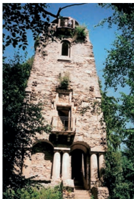
Rozhledna na Zelené hoře