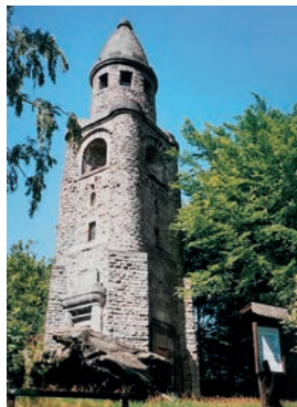
Rozhledna na Háji u Aše

parkovišti u bývalé kaple svaté Anny. Odtud půjdeme po cestě dál pěšky necelý kilometr. V lese pak odbočíme vlevo na lesní cestu a asi po 150 metrech vystoupáme k rozhledně. Převýšení od auta činí asi 60 metrů. Kamenná rozhledna, zvaná Bismarckova, která je vzdálená zhruba 300 metrů od televizního vysílače, tady byla postavena v roce 1909 a měří 18 metrů. V roce 2005 byla zrekonstruována a po vykáčení některých stromů umožňuje docela hezký výhled. Když na její vyhlídkový