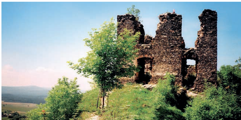
Hrad Andělská Hora

Na hradě prý byla v době předbělohorské alchymistická laboratoř, ve které pracoval známý alchymista Jakob Tenzel. Andělská Hora se proslavila i relativně nedávno, neboť zde byla natočena část filmu Balada pro banditu .