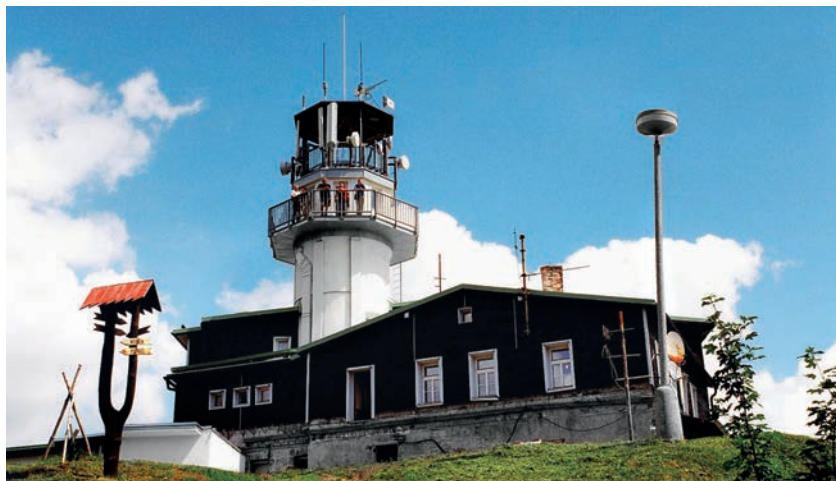
Rozhledna na Plešivci

Nad obcí Abertamy, mezi Nejdkem a Božím Darem v Krušných horách, se v nadmořské výšce 1028 metrů tyčí kopec Plešivec s rozhlednou. Přístup k ní je velmi snadný. Z městečka Abertamy je možno po úzké horské silničce dojet autem