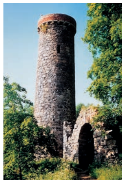
Rozhledna na Hamelice před rekonstrukcí

Když se vrátíme zpět do Mariánských Lázní, které jsou po Karlových Varech naším druhým největším lázeňským městem, můžeme se projít po kolonádě, ochutnat minerální vodu a současně si také prohlédnout některé architektonicky pozoruhodné stavby. V okolí Mariánských Lázní se nachází několik dalších turisticky zajímavých míst, například přírodní rezervace a rašeliniště, kde ze země vyvěrá oxid uhličitý a sirovodík v podobě mofet.