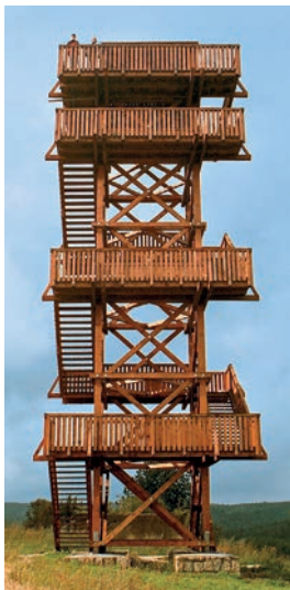
Rozhledna na návrší Nad dvorem

Když na zpáteční cestě sjedeme z kopce, uvidíme vpravo u cesty kamenný sloup, který je patrně pozůstatkem vstupní brány do bývalého zámeckého parku. Když se vydáme po cestě, která u něj začíná, dojdeme zhruba po 100 metrech k palouku, na němž spatříme trosky bývalého zámku, pocházejícího z roku 1715. Ruiny působí dosti ponuře, mimo jiné i proto, že jsou zarostlé zdravými nebezpečnými rostlinami – bolševníky, které jako by strážily vstup do zámku.