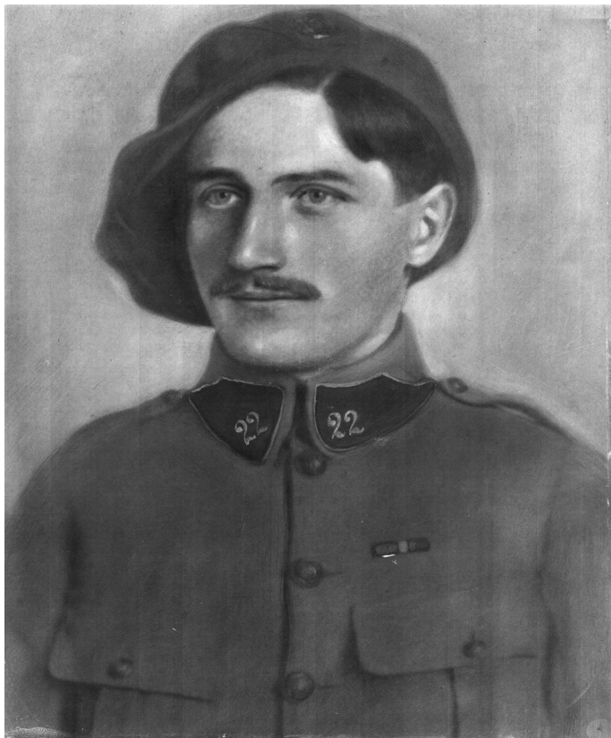
Otec jako francouzský legionář.

To byly první poznatky tohoto druhu, které mě později přivedly k lásce k matematice a k fyzice.