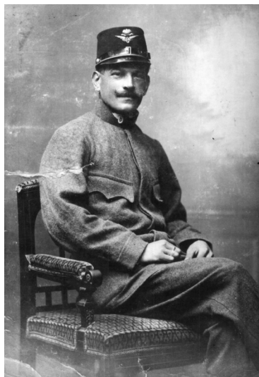
Otec jako rakouský voják ve výcházkové uniformě.