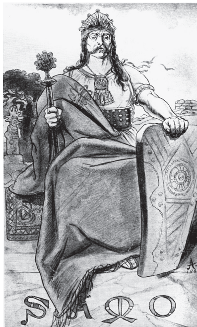
Kníže Sámov představě Mikoláše Alše

záležitosti a dohodu. Přece jen mu záleželo na dobré pověsti své říše. Namyšlený Dagobertův vyjednaváč Sicharius ale jiné urovnání než tučnou náhradu odmítl se slovy, že „není možno, aby křesťané a sluhové boží mohli uzavřít přátelství se psy“. To byla od něj pořádná drzost a Sámov rázem zapomněl, že je původem také Frank. Jménem všech Slovanů se urazil a vmetl Dagobertovu vyslanci do očí velmi ostrá slova, která si tento za rámeček jistě nedal: „Jestliže vy jste sluhové boží a my jsme boží psi, tu když vy ustavičně proti němu jednáte, nám je dovoleno trhat vás svými