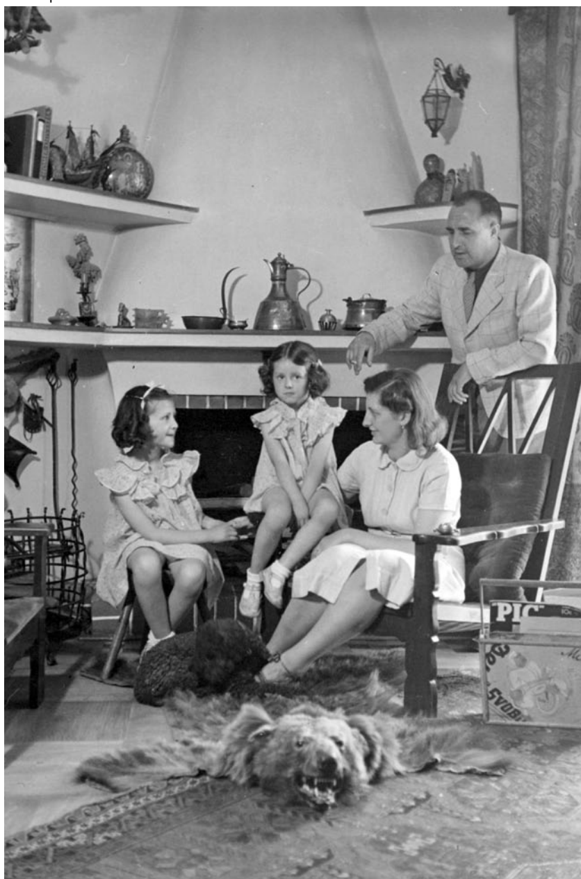
Tamara, pudlík Puk, Nina, Elmarita, Tunal – dodnes jsou věci v brněnské vile na svém místě