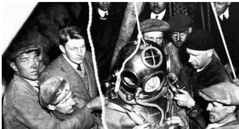
První výprava pod hladinu