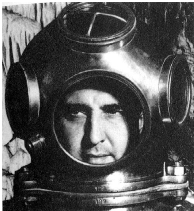
Tunal – muž mnoha profesí