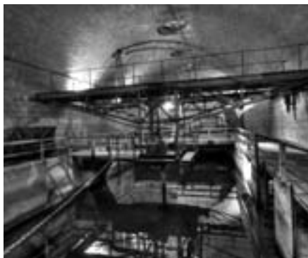
Obr. 4 Lapák písku; původní pražská čistírna

1901 a 27. června 1906 byl zahájen zkušební provoz.