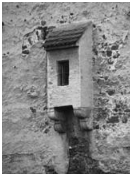
Obr. 2 Prevět

V měšťanských domech se výkaly soustřeďovaly do nádob a vylévaly z oken přímo na ulici. Od 13. století sloužily ve městech pro ukládání veškerých odpadů z domácností odpadní jámy. Byly to jámy umístěné v zadní části dvora s dřevěným pažením a vrstvou