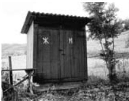
Obr. 3 Suchý záchod 20. století, Podkarpatská Rus

Commision on Sewage Disposal. Tato komise si vzala za svou především koordinaci prací, které směřovaly k rozpoznání faktorů ovlivňujících kvalitu vody v povrchových vodách. Jedním z výsledků je například metoda pro hodnocení biologického znečištění doporučená roku 1908 (používaná dodnes) a návrhy biologického čištění odpadních vod pomocí zkrápených biofiltrů, které představují nejstarší inženýrské řešení likvidace odpadních vod. Mezi první tohoto typu uvedené do provozu v Rakousku-Uhersku je biofiltr pro město Mödling u Vídně (1904) a biofiltr u hotelu Radium Kurhaus v lázních Jáchymov (1910, dnes Radium Palace).