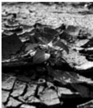
Obr. 1 Nebezpečí sucha

Pokud stojíte před otázkou, zda čistírnu ano, či ne a jakou, pak právě pro vás je určena tato příručka, která se snaží podat stručný přehled postupů a poznatků při řešení problematiky čištění odpadních vod z malých zdrojů znečištění do 50 obyvatel. Všem čtenářům publikace pak budeme vděčni za náměty, které by posloužily pro zdokonalení eventuálního příštího vydání.