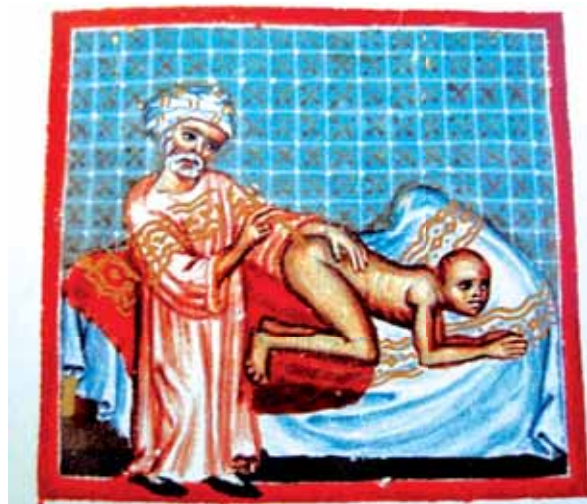
Obr. 1.3 Vyšetřování v Isfahánu

Ve středověku vynikly lékařské školy v Salernu (Sardínie – Ugo de Borgognoni, 1160–1257), Isfahánu (Persie – Avicenna ibn Sina, 980–1037) (obr. 1.3), Boloni (Guglielmo di Saliceto, 1210–1277) a Padově (Bruno da Longoburgo).