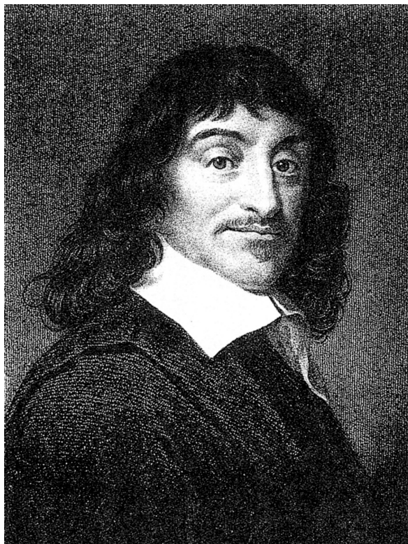
Obr. 1 René Descartes

světem své soukromí i nejdůležitější myšlenky a důvěřoval především svému vlastnímu úsudku. Neplodnějším údobím Descartova života byl dvacetiletý pobyt v Holandsku (od roku 1629), kde pobýval raději než v rodné Francii, a to pravděpodobně kvůli vnější i vnitřní nezávislosti. V roce 1649 odjel Descartes na pozvání královny Kristiny do Švédska, kde však brzy podlehl vlivům nezvyklého klimatu. Královna Descarta nutila, aby ji vyučoval od pěti hodin ráno ve špatně vytopené knihovně. Po čtyřech měsících se francouzský učenec nachladil a zemřel na zápal plic (Schultz, Schultz, 1992, s. 31–32; Störig, 1995, s. 228).