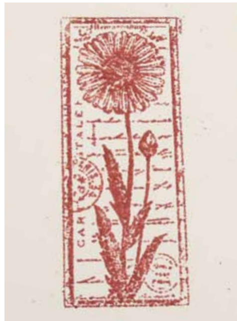
Embosovaný motiv je výrazný a plastický

Protože horkovzdušná pistole stojí několik set korun, můžete si embosování nejdřív vyzkoušet i bez ní. Prášek se totiž roztaví i tehdy, když ho podržíte těsně nad rozpálenou sklokeramickou varnou deskou nebo nad topinkovačem. U topinkovače doporučuji používat nějaký starý, vyřazený, protože do něj při manipulaci může část prášku spadnout – a takové “embosované” topinky určitě nebudou příliš zdravé. Další možností je využití běžné horkovzdušné pistole z dílny manžela či otce. Tam ale dávejte pozor na teplotu a pracujte jen s nejnižším stupněm. Pokud se vám ale embosování zalíbí, doporučuji pistoli koupit, práce s ní je jednoduchá a výsledek zaručený. Jen pozor u malých dětí – vzduch je opravdu velmi horký a mohlo by dojít ke zranění.