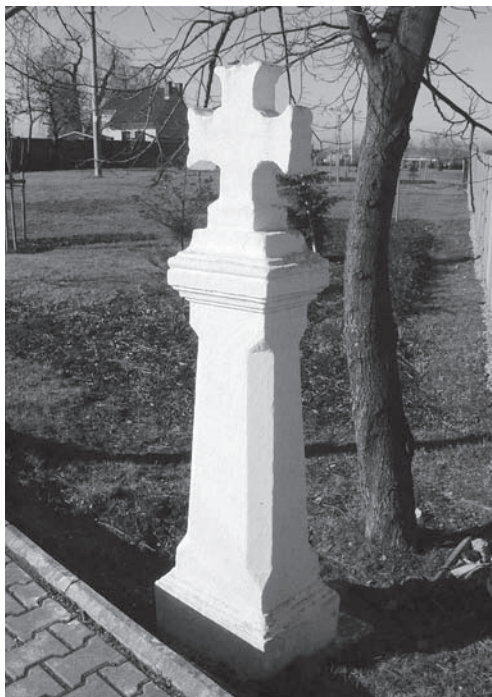
Barokní kříž na vizuálně zvýrazněném sloupku. Velká Dobrá u Kladna

Boleslava I. (do r. 967), který vydal pokyn k jejich stavění. Z kontextu známých skutečností vyplývá, že zdaleka ne vždy šlo o sloupovité objekty (do této skupiny se nejspíše řadily i různé formy křížů) ani nemusely být vždy kamenné. Naopak se zdá, že převažujícím materiálem bylo po celý středověk dřevo. Ale důležité pro nás je, že součástí tohoto širokého a různorodého souboru byly nepochybně i mariánské sošky na vysokých podstavcích sloupovitého tvaru.