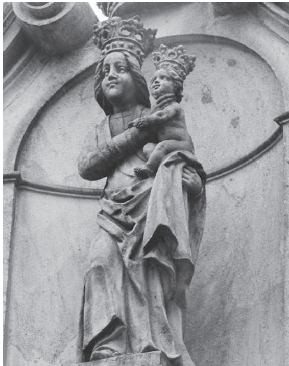
Panna Marie Svatohorská, zvětšená barokní parafráze gotické sošky na bočním portálu poutního areálu na Svaté Hoře v Příbrami

Stěžejní význam pro vývoj uměleckého motivu madony měla doba Karla IV., tedy nejvytříbenější období vrcholné gotiky. Marie byla zobrazována v ustálených formách a jejich variantách, které často tvořily základ pro další repliky a volné napodobování.