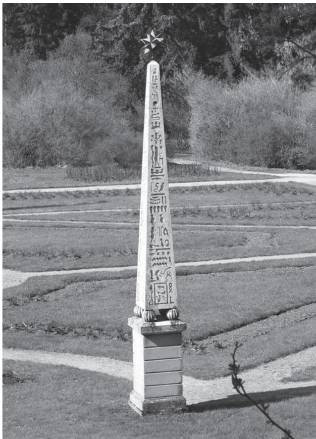
Kopie egyptského obelisku. Růžová zahrada, Konopiště

Je tedy mylná představa, že vážný zájem o Egypt projevil až Napoleon, který tam spolu se svojí armádou vyslal i tým badatelů. To byla pouze první vědecká expedice, zatímco objevitele a sběratele přitahoval obtížně dostupný Egypt už více než sto let.