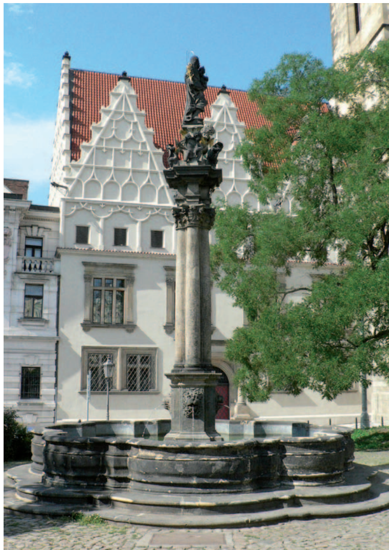
Sloup sv. Josefa před Novoměstskou radnicí v Praze

Tak se průvodním jevem nástupu novověku stal nebývalý nárůst zájmu o řecko-římskou klasiku i o zaniklé kultury Východu. Mezi nimi pochopitelně zaujal stěžejní pozici starý Egypt.